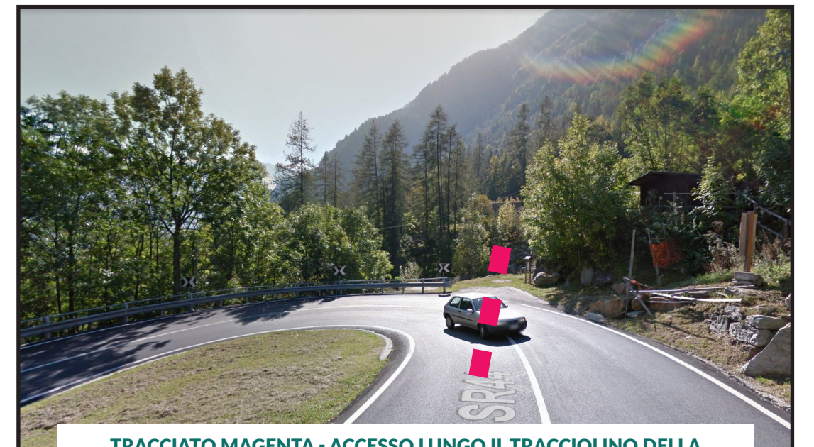
TRACCIATO MAGENTA - ACCESSO LUNGO IL TRACCIOLINO DELLA CONDOTTA FORZATA