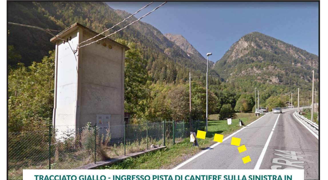
TRACCIATO GIALLO - INGRESSO PISTA DI CANTIERE SULLA SINISTRA IN PROSSIMITÀ DEL TORRINO DEVAL