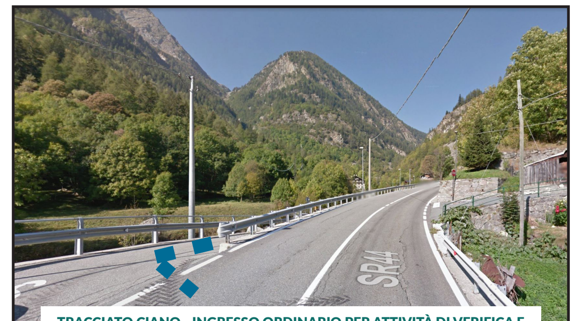
TRACCIATO CIANO - INGRESSO ORDINARIO PER ATTIVITÀ DI VERIFICA E ISPEZIONE