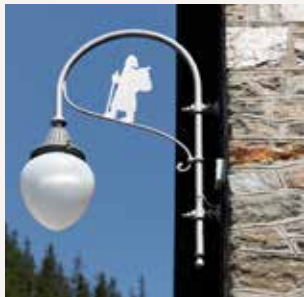
Symbole du pèlerin figurant sur les réverbères de Saint-Rhémy-en-Bosses, le long de la Via francigena .

Plus de 2000 ans après, la Route romaine des Gaules existe encore en bonne partie : avec son tronçon extraordinaire à Donnas, ses ponts à Saint-Vincent, Châtillon et Aoste, ses imposantes substructures encore visibles à Introd, Arvier et Aise, ses coupes dans la roche et ses mansiones situées à plus de 2000 mètres d'altitude.