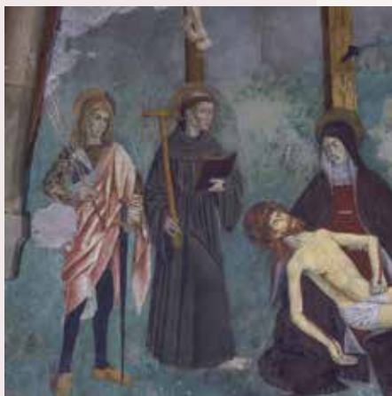
Pietà avec saint Sébastien et saint François (ante 1481), église paroissiale Saint-Hilaire de Gignod (détail)

Il ne fait aucun doute que les stigmates qui marquent ses mains, ses pieds et son buste constituent son attribut le plus significatif. Ils font référence à un moment particulier de la vie de François, quand ce dernier décide, en 1224, de passer complètement seul sur le mont de La Verna le carême de saint Michel, c'est-à-dire les quarante jours qui précèdent le 29 septembre, et que là, en ces journées de méditation et de prière, Dieu lui accorde un sceau spécial : la marque des cinq stigmates.