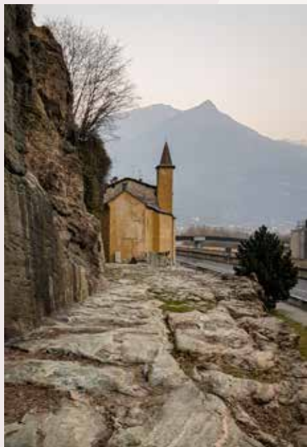
Tratto della strada romana delle Gallie a Donnas. Sullo sfondo la cappella intitolata a Sant'Orso.

Per posizione geografica, storia e cultura, la Valle d'Aosta è sempre stata “intermedia” fra la Francia, l'Italia e la Svizzera.