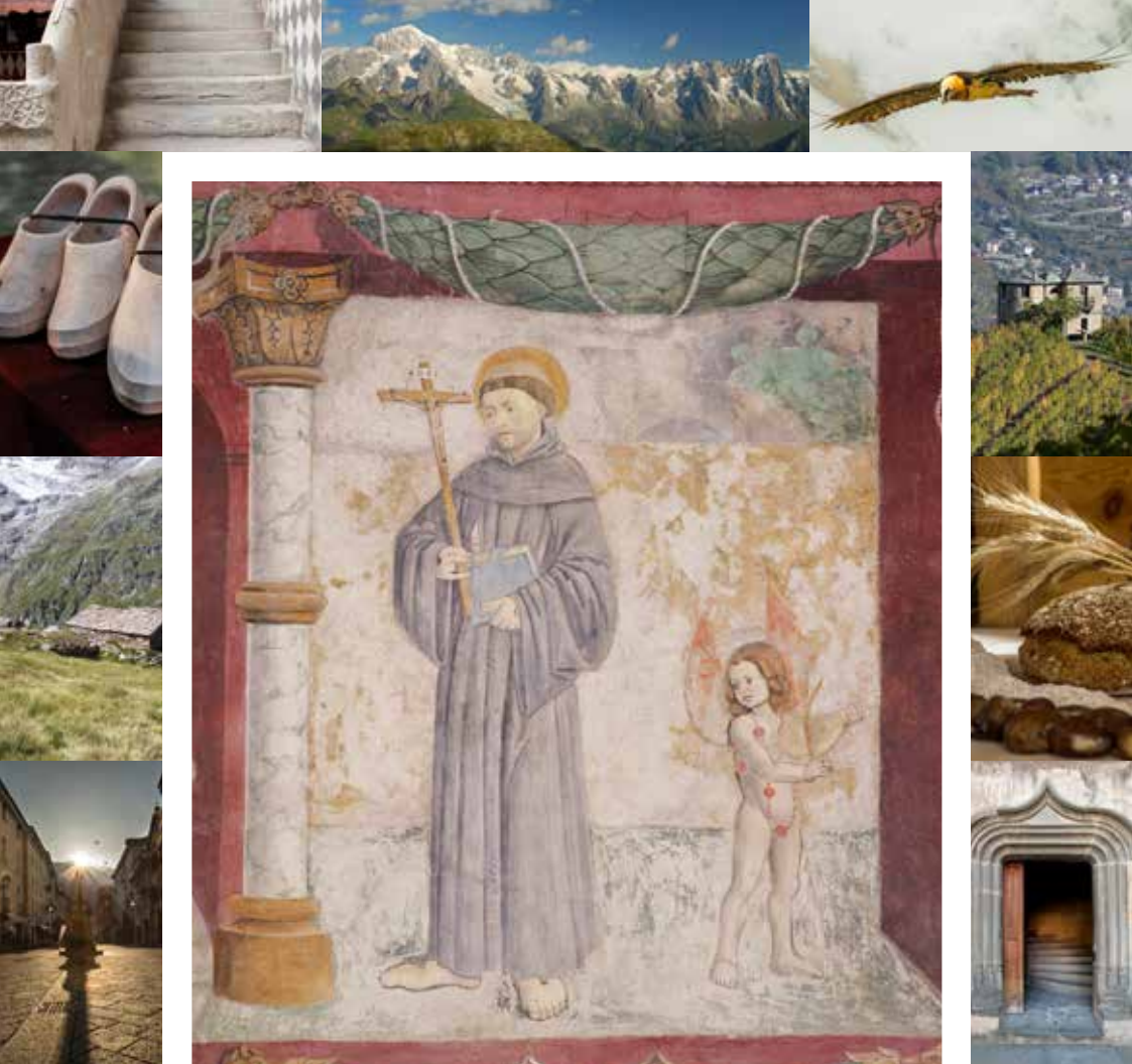
Saint-François d'Assise, 1496-1498, façade de l'ancien couvent Sainte-Catherine (détail), Aoste