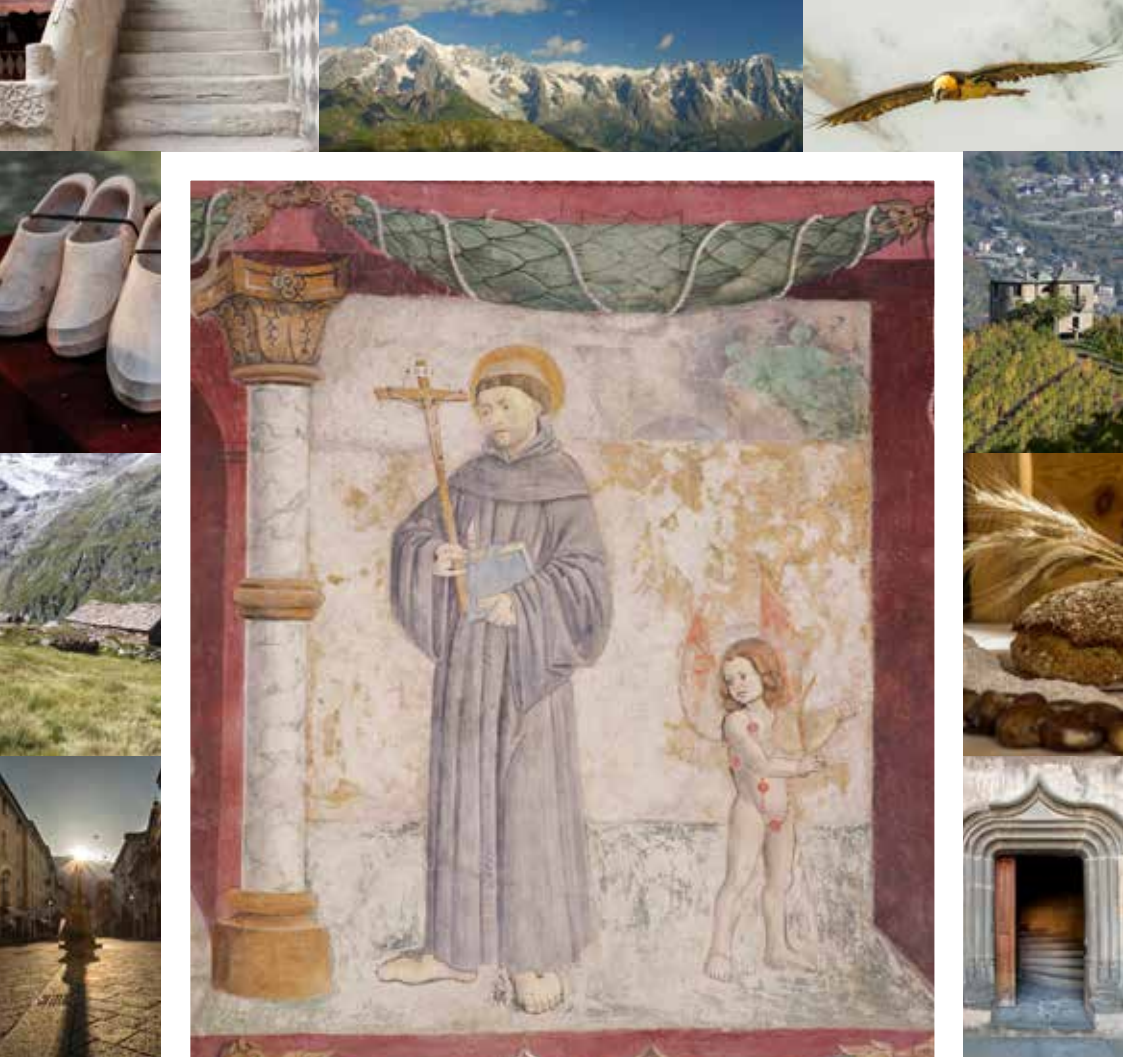
San Francesco d'Assisi, 1496-1498, facciata, ex convento di Santa Caterina, Aosta (part.)