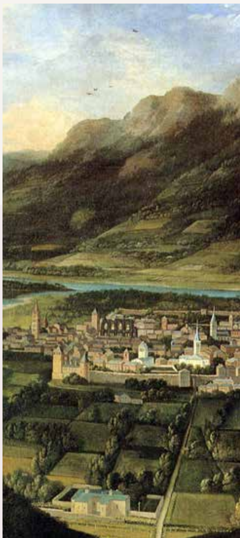
Aoste au XVII e siècle, détail. A droite, le clocher de l'église Saint-François; en bas, le couvent des Capucins

Au cours des mêmes années, dans la zone précédant l'entrée d'Aoste, entre l'Arc d'Auguste et la Porte prétorienne, est construite une basilique funéraire cruciforme, près de laquelle, peu de temps après, est réalisée une seconde église, qui constitue le centre de l'apostolat du prêtre Ours et auprès de laquelle allait s'installer une importante communauté de chanoines. Vers la fin du VIII e siècle, le diocèse fait partie de la province ecclésiastique transalpine de Tarentaise, à laquelle il reste lié jusqu'en 1862. Durant cette même période, s'y développe le rite valdôtain, un rite particulier qui ne fut aboli qu'en 1828. Le deuxième millénaire s'ouvre à l'enseigne d'une ferveur religieuse renouvelée, dont sont l'expression, d'une part, les splendides rénovations de la cathédrale et de l'église Saint-Ours, à l'époque de l'évêque Anselme (994-1025) et, d'autre part, l'adoration de deux saints très populaires dans la région comme à l'extérieur : Bernard, archidiacre d'Aoste et fondateur des hospices sur les cols qui porteront plus tard son nom (1022 env. - 1081), et un autre Anselme (+1109), philosophe et théologien, archevêque de Cantorbéry et Père de l'Église.