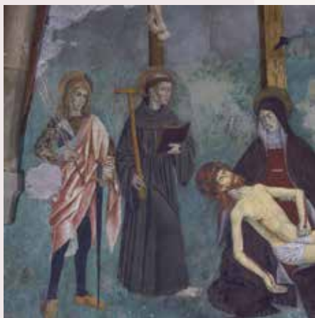
San Sebastiano, San Francesco e la Pietà, ante 1481, chiesa parrocchiale di Sant'Ilario, Gignod (part.)

Esse fanno riferimento a un particolare momento della vita di Francesco, quando nel 1224 decise di trascorrere da solo alla Verna la quaresima di San Michele, ovvero i 40 giorni precedenti il 29 settembre, e là, in quei giorni di meditazione e preghiera,