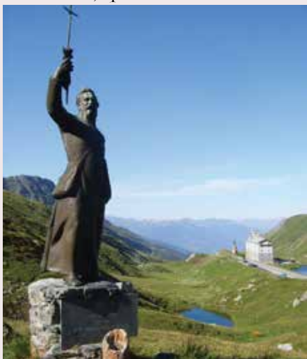
La statue de l'abbé Chanoux, au col du Petit-Saint-Bernard. Au fond, l'hospice fondé par saint Bernard d'Aoste au XI e siècle.

La Vallée d'Aoste, carrefour stratégique entre les Alpes, est également parcourue par un autre important itinéraire culturel : le Chemin de saint Martin de Tours , qui est le premier à relier l'Europe de l'Est à l'Europe de l'Ouest, de Szombathely en Hongrie (où « l'Apôtre des Gaules » naquit en 316 après J.-C.) à Candes-Saint-Martin en Touraine (où il mourut en 397). Ce long itinéraire sur les traces de saint Martin, connu comme « saint du partage » en vertu du célèbre partage de son manteau, représente parfaitement les valeurs du dialogue interculturel, dont les traces plurimillénaires caractérisent cette petite, mais cruciale, terre de frontière.