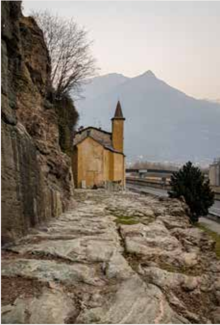
Tronçon de la Route romaine des Gaules à Donnas. Au fond, la chapelle Saint-Ours.

Du fait de sa position géographique, la Vallée d'Aoste est depuis toujours un point de rencontre entre la France, l'Italie et la Suisse. Située entre les Alpes Graies et les Alpes Pennines, la plus petite région d'Italie est encerclée par les montagnes les plus élevées d'Europe, dont le Mont-Blanc (4810 m), le Mont-Rose (4634 m) et le Grand-Paradis (4061 m), ainsi que le Cervin (4478 m), icône des Alpes par excellence, que John Ruskin a défini comme « la montagne la plus noble d'Europe ».