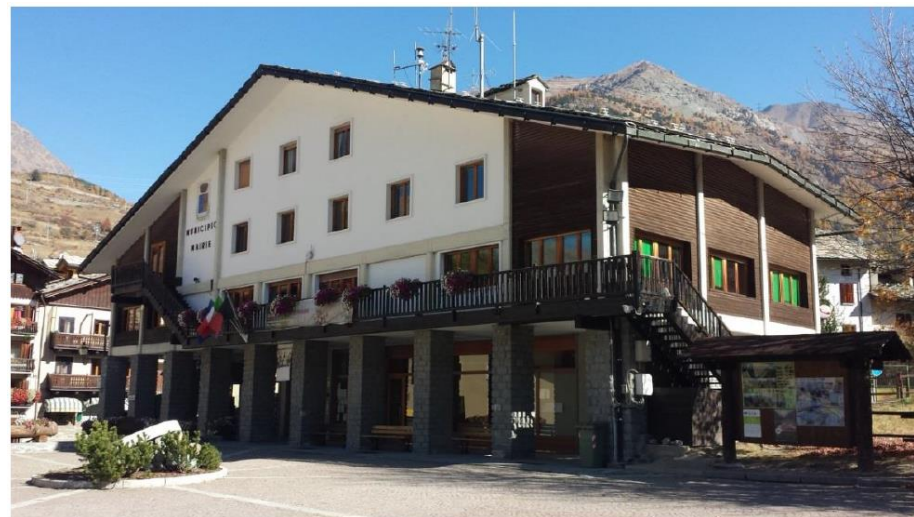
Figura 3 - Prospetti sud e ovest