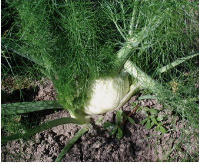
Grumo di finocchio

CARATTERISTICHE la parte commestibile è il grumo formato dai fusti carnosì e bianchi e dalle foglie. Predilige i terreni fertili e non ha bisogno di temperature elevate per svilupparsi bene. Non ama i ristagni di acqua.