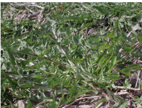
Cicoria spontanea (Tarassaco)