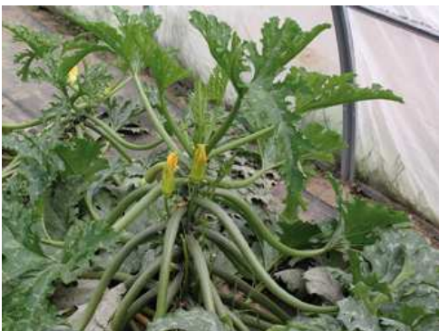
Zucchine in serra

La semina a dimora è consigliata dal mese di giugno al mese di agosto. Può essere effettuata anche in semenzaio, in appositi contenitori che permettano di ottenere piantine munite di zolletta di terra che avranno una migliore ripresa al trapianto. Alle temperature estive la germinazione dei semi avviene rapidamente.