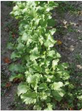
Cime di rapa in campo

Le cure colturali dopo il trapianto consistono nel rincalzare le piantine per assicurare un buon sostegno e servire da lotta contro le malerbe sebbene le cime di rapa, le varietà precoci soprattutto, abbiano una crescita rapida che permette loro di prendere velocemente il sopravvento sulle malerbe, soprattutto nel caso di colture autunnali. Le temperature superiori a 20°C favoriscono l'apertura dei fiori di colore giallo.