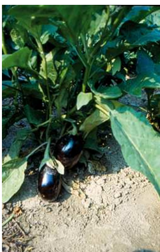
Melanzana pianta e frutti

Per ottenere piantine ben sviluppate si consiglia di eseguire la semina in semenzaio (serra, cassone caldo, ecc.) nei mesi di marzo-aprile. La messa a dimora delle piante deve essere eseguita quando il terreno e l'aria raggiungono la temperatura di 16-25° C (maggio-giugno). La melanzana sopporta male il freddo, a temperature inferiori a 10-12° C arresta la propria attività (le piante e i frutti rimangono piccoli e non maturano) ed è molto sensibile alle gelate. Per migliorare la ripresa al trapianto e per avere un accrescimento più rapido, le piantine devono avere una zolletta di terra. Il sesto di impianto è di 60-80 cm tra le file e di 50 cm tra una pianta e l'altra. Il ciclo colturale annuale varia da 150 a 180 giorni. Si consiglia di eseguire la coltura su pacciamatura (ad esempio agritelo) per facilitare la maturazione (il colore nero attira i raggi del sole). Consociazione: favorevole quella con cavoli, finocchio e lattughe.