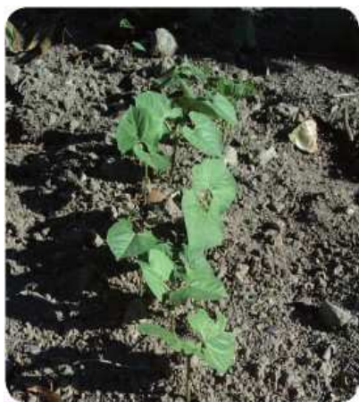
Piantine di fagioli a inizio sviluppo

Il fagiolo è intollerante alla salinità del terreno e soffre molto gli abbassamenti di temperatura: muore a 1-2° C, per questi motivi nella nostra regione la sua coltivazione è consigliata nel solo periodo primaverile ed estivo. Il fagiolo teme inoltre la siccità: in questo caso la pianta appassisce durante le ore più calde, i baccelli abortiscono o contengono pochi semi che non raggiungono il pieno sviluppo.