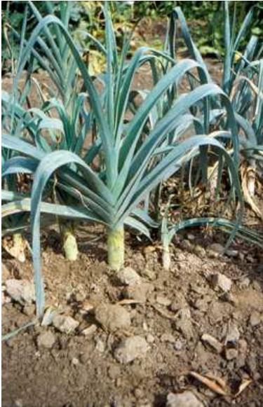
Campo di porri