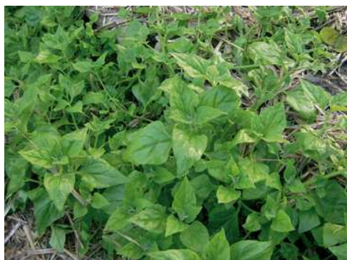
Tetragonia (spinacio Nuova Zelanda)

La semina a dimora è consigliata da marzo ad aprile e da fine agosto a inizio ottobre. La germinazione dei semi avviene rapidamente anche a temperature basse. Il sesto di impianto consigliato è di 20-30 cm tra le file e 30-40 cm sulla fila.