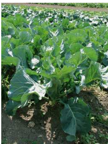
Cavolfiori in campo

La semina è consigliata al mese di giugno per permettere il trapianto a dimora al mese di luglio. Come per gli altri cavoli, può essere effettuata in semenzaio in appositi contenitori alveolati che permettono di ottenere le piantine munite di zolletta di terra. In questo modo sarà garantita una migliore ripresa al trapianto. La germinazione dei semi avviene rapidamente, dato che le temperature estive di norma sono elevate. Preferire però una situazione ombreggiata nei momenti più caldi della giornata. La semina diretta in campo è possibile ma poco praticata.