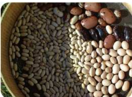
Semi di fagioli

PROPRIETA E CURIOSITA: i fagioli sono molto nutrienti e, come tutti i legumi, sono ricchi di proteine e di vitamina A e C. Contengono inoltre calcio, fosforo, ferro e potassio. Alcune varietà, delle quali si possono mangiare anche i baccelli, sono dette “fagiolo mangiatutto”. Le leguminose, molto diffuse e apprezzate nell'alimentazione contadina, vengono da sempre considerate la “carne dei poveri”, grazie al loro elevato contenuto proteico e al loro basso costo.