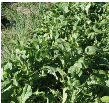
Rape in pieno campo

La rapa cresce bene su terreni sciolti, ben drenati, fertili e freschi. Sopporta discretamente il freddo, ma teme gli eccessi di caldo: è quindi consigliabile la coltura primaverile o autunnale. Come la carota predilige i terreni concimati l'anno precedente.