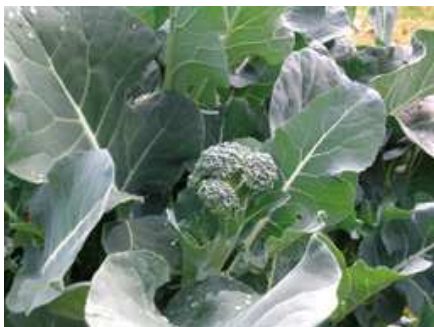
Cavolo broccolo, pianta e infiorescenza

Come per le altre varietà di cavoli, la semina può essere effettuata in semenzaio oppure negli appositi contenitori alveolari, per munire le piantine di zolletta di terra. La semina è consigliata a marzo, per un trapianto a dimora da effettuare in aprile, e a giugno, per un trapianto a dimora nel mese di luglio. Usando le varietà ramoso la raccolta è assicurata da aprile a novembre.