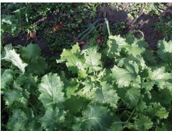
Cime di rapa, pianta

Le cime di rapa coltivate nella nostra regione in montagna non hanno parassiti, mentre nel fondovalle possono verificarsi, in qualche caso, problemi di afidi. Per tali parassiti è consigliabile utilizzare macerazioni con erbe (ortiche, timo, ecc.), sapone bianco di Marsiglia o altri prodotti naturali.