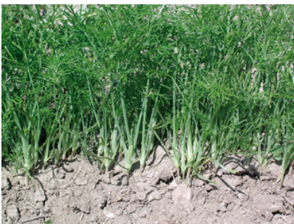
Piantine di finocchio

I finocchi si coltivano seminandoli direttamente a dimora all'inizio dell'estate (fine giugno, inizio luglio) per la raccolta autunnale, in file distanti circa 35-45 cm. Quando le piante hanno raggiunto i 5-8 cm si diradano, lasciando tra ogni piantina circa 20-25 cm di spazio, per garantirne lo sviluppo corretto. A quote elevate è preferibile effettuare nello stesso periodo il trapianto, utilizzando piantine munite di zolletta di terra. La concimazione organica, consistente in circa 300-400 kg di compost per 100 mq di orto, deve precedere la semina e deve essere interrata leggermente.