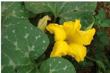
Fiore di zucca

La semina è eseguita ad aprile in semenzaio in vasetti di torba oppure direttamente a dimora in postarelle (alcuni semi per ogni buco) dove poi si lascia crescere una sola pianta. Il periodo ottimale per la semina è fine maggio-inizio giugno, quando la temperatura del terreno è sufficientemente calda. Anche il trapianto dei vasetti di torba avviene in questo periodo. La zucca sopporta male il trapianto quindi dove è possibile è meglio eseguire la semina diretta in campo (le piante crescono più sane). Il sesto di impianto consigliato è di 120-150 cm tra le file e 200-250 cm sulla fila.