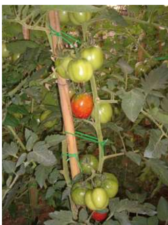
Pomodoro pianta e frutti

La semina diretta in campo è possibile, ma poco utilizzata nella nostra regione. Per ottenere piantine ben sviluppate e anticipare la raccolta, si consiglia di eseguire la semina in serra, cassone caldo, ecc.) nei mesi di febbraio-marzo. La messa a dimora delle piante deve essere eseguita quando il terreno e l'aria raggiungono la temperatura di 16-25° C (maggio-giugno). Il pomodoro è una pianta con elevate esigenze termiche e assai sensibile al gelo. La temperatura minima per la fioritura è di 21° C e le temperature più favorevoli all'ingrossamento dei frutti e alla loro maturazione sono 24-26° C di giorno e 14-16° C di notte. Le temperature troppo elevate, superiori a 30° C, provocano difetti di allegagione e di colorazione. Per migliorare la ripresa al trapianto e per avere un accrescimento più rapido, le piantine devono avere una zolletta di terra. Il sesto di impianto è di 60- 80 cm tra le file e di 50 cm tra una pianta e l'altra. Il ciclo colturale annuale varia da 150 a 180 giorni. Si consiglia di eseguire la coltura su pacciamatura (ad esempio agritelo) per facilitare la maturazione (il colore nero attira i raggi del sole).