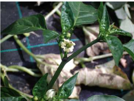
Fiore di peperone

Jolly, Diablo, Giallo, Rubens, ibridi, F1.