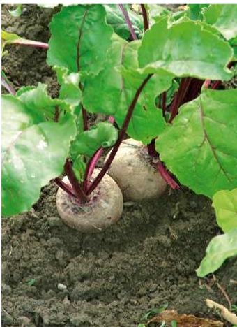
Bietola da orto rossa in pieno campo

La bietola da orto rossa cresce bene su terreni sciolti, ben drenati, fertili e freschi. Tollera discretamente il freddo, ma interrompe il suo accrescimento al di sotto dei 5°C. E' considerata una coltura sarchiata, quindi è preferibile non farla seguire ad altre coltivazioni di Chenopodiacee e mais.