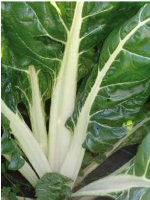
Particolare coste fogliari, bieta

La raccolta inizia a circa 30 giorni dal trapianto e a 60 giorni dalla semina. Per la specie a coste si raccolgono le foglie esterne man mano che si sviluppano durante il ciclo produttivo, che può protrarsi l'anno successivo, oppure si recidono le piante al piede effettuando un solo raccolto. Per le varietà da taglio, recidere le foglie ad alcuni cm dal terreno più volte (3-5) durante l'anno. Le piante, con l'arrivo del freddo, possono anche essere conservate in cantina, nella sabbia, avendo cura di scalzarle con una buona zolla di terra.