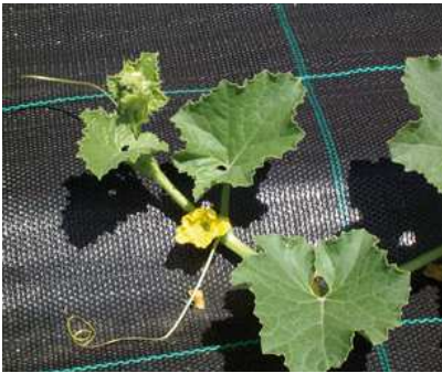
Fiore del melone

Si consiglia di eseguire la coltura su pacciamatura (ad esempio, telo nero steso sul terreno) per facilitare la maturazione (il colore nero attira i raggi del sole) ed evitare allo stesso tempo marciumi indesiderati e la concorrenza delle malerbe. Ad inizio coltura le piante vanno cimate a cinque foglie per farle ramificare e irrobustire. Successivamente vanno poi accorciati nuovamente i butti laterali a 3-5 foglie situate dopo i primi frutticini. Per favorire una buona maturazione lasciare 5-6 frutti per pianta. La raccolta si fa quando i frutti cambiano colore e diventano profumati. Se il melone è ben maturo, si stacca facilmente dalla pianta. Con l'utilizzo della pacciamatura il melone non richiede cure particolari, salvo irrigazioni frequenti e ben dosate, soprattutto per evitare spaccature quando i frutti vanno a maturazione. Le piante possono essere lasciate crescere adagiate liberamente sul terreno o sulla pacciamatura oppure allevate in verticale su appositi sostegni (pali di legno, fili, ecc.). La resa alla raccolta è di circa 4-8 kg a metro quadrato ed è eseguita scalaramente, perché i frutti non si formano tutti nello stesso momento.