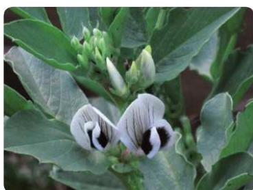
Fiori di fava

PROPRIETA E CURIOSITA: le fave hanno un elevato contenuto di proteine, fibre, vitamine di tipo B, fosforo e ferro. Contengono inoltre, in quantità minori, vitamina C e potassio. Nell'antichità erano utilizzate per votare: formulata la questione, si usavano le fave nere per esprimere il sì e quelle bianche per il no.