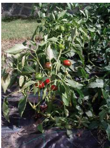
Peperone, pianta e frutti a inizio maturazione.

Per ottenere piantine ben sviluppate si consiglia di eseguire la semina in semenzaio (serra, cassone caldo, ecc.) nei mesi di febbraio-marzo-aprile. La messa a dimora delle piante deve essere eseguita quando il terreno e l'aria hanno raggiunto la temperatura di 18-20° C (maggio-giugno). Il peperone non sopporta il freddo (le piante e i frutti rimangono piccoli e non maturano) ed è molto sensibile alle gelate. Per migliorare la ripresa al trapianto e per avere un accrescimento più rapido, le piantine devono avere una zolletta di terra. Il sesto di impianto è di 50-60 cm tra le file e di 40-50 cm tra una pianta e l'altra. Il ciclo colturale (annuale) varia da 4 a 5 mesi. Si consiglia di eseguire la coltura su pacciamatura (ad esempio agritelo) per facilitare la maturazione (il colore nero attira i raggi del sole) ed evitare marciumi indesiderati.