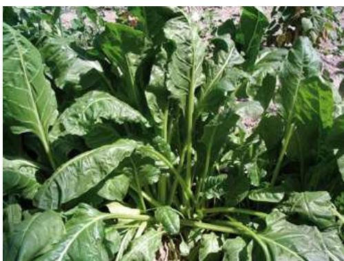
Coste da taglio

Si adatta bene a tutti i tipi di terreno, purché siano profondi, ben aerati e freschi, ricchi di sostanza organica e con PH neutro oppure leggermente alcalino (6,5-7). Di norma è una pianta molto resistente, si adatta, sia al freddo che alle alte temperature. Si sviluppa senza problemi anche in montagna soprattutto nel periodo estivo e autunnale. Può, in alcuni casi, passare l'inverno sotto la neve per ricacciare e formare il cespo ad inizio primavera. In questo ultimo caso, deve essere consumata rapidamente perché la pianta tende ad anticipare l'induzione a fiore.