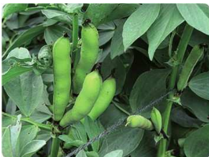
Baccelli di fave