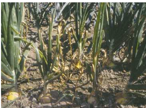
Campo di cipolle

Cresce bene su ogni tipo di terreno, però predilige quelli a pH 6-7 limoso-sabbiosi, ben drenati, ricchi di sostanza organica (letame o compost). Per quanto riguarda il clima, preferisce una situazione calda e ben riparata, però sopporta bene anche il freddo. Quindi, si può coltivare tranquillamente su tutta la Valle d'Aosta, sino ad altitudini elevate (circa 2000 m slm).