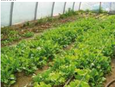
Lattuga in serra

Se coltivate in montagna le lattughe, di norma, non temono parassiti, mentre in pianura possono verificarsi problemi di afidi.