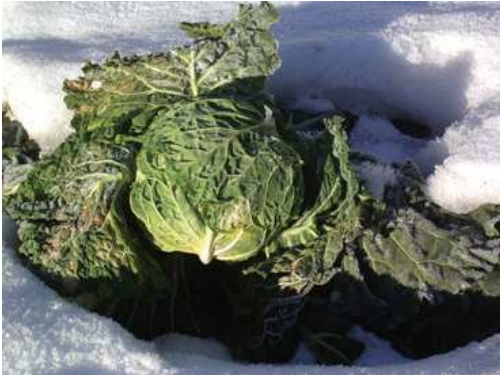
Cavolo verza ben conservato nella neve.

Le irrigazioni, mai troppo abbondanti, possono essere eseguite per aspersione ad inizio coltura e preferibilmente per scorrimento al momento della formazione delle teste. Quando queste hanno raggiunto una buona compattezza, le irrigazioni troppo abbondanti possono provocarne la spaccatura. Per garantire un buon dosaggio dell'acqua è preferibile adottare i sistemi di microirrigazione come il gocciola a gocciola durante l'intero periodo vegetativo.