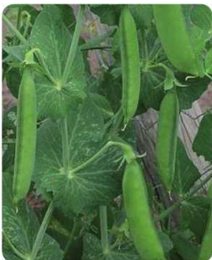
Baccelli di piselli