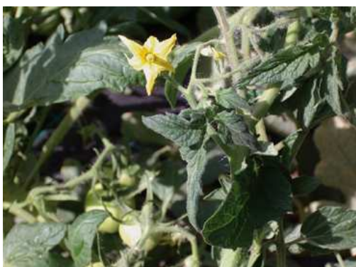
Fiore di pomodoro

Roma, San Marzano, Costoluto, Cuore di bue, ibridi, F1.