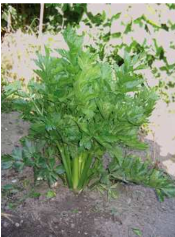
Coste di sedano

Con l'arrivo del freddo le piante possono essere conservate in cantina nella sabbia, avendo cura di scalzarle con una buona zolla di terra. Le foglie e gli steli possono essere raccolti durante tutta la stagione vegetativa e consumati freschi oppure surgelati (tagliati a pezzetti e posti in sacchetti). In frigorifero si conserva per una settimana.