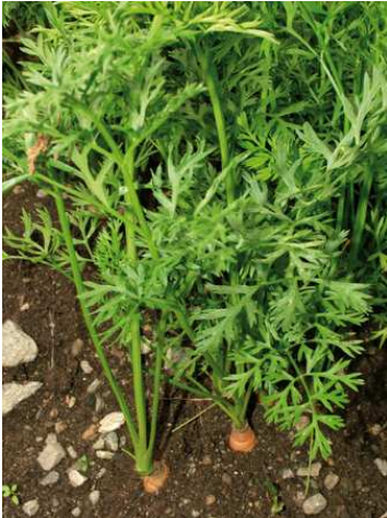
Carote in pieno campo