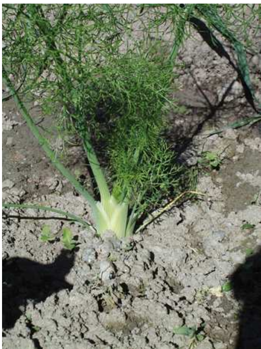
Finocchio a inizio sviluppo. Grumo

Con l'arrivo del freddo le piante possono essere conservate in cantina, nella sabbia, avendo cura di scalzarle con una buona zolla di terra. In frigorifero, si conserva una decina di giorni.