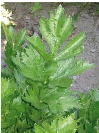
Particolare, di foglia di sedano

NOME SCIENTIFICO: Apium graveolens L. var dulce Mill. NOME FRANCESE: Céleri à côtes.