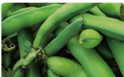
Baccelli di fave

ad inizio coltura e preferibilmente per scorrimento in seguito. Per garantire un buon dosaggio dell'acqua è preferibile adottare i sistemi di microirrigazione, come il sistema goccia a goccia durante l'intero periodo vegetativo. La coltivazione delle fave nella nostra regione è sempre stata abbinata con successo a quella delle patate. Il raccolto è scalare, si comincia dalle fave che hanno sviluppato un baccello sufficientemente maturo. Per consumarle fresche bisogna raccoglierle al momento giusto: se troppo grandi risulterebbero dure e insapori, se troppo piccole tenere ma amarognole. La resa alla raccolta è di 0,5-1 kg di fave fresche al metro quadrato. Per la conservazione le fave fresche possono essere congelate. La conservazione del seme, fatto essiccare bene all'ombra, può essere effettuata in sacchetti di carta o scatole di cartone ben sigillate, oppure può essere conservato in congelatore dato che, come avviene per i fagioli, i semi mantengono la loro germinabilità.