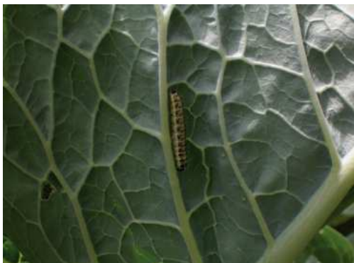
Bruco di cavolaia su foglia di cavolo cappuccio.

Se coltivato in montagna il cavolo cappuccio, di norma, non teme parassiti. In pianura possono verificarsi, invece, problemi di afidi, di cimici, di nottue come la cavolaia e di mosca del cavolo. Quest'ultima è la più nociva perché provoca il marciume del colletto, con relativa morte della pianta. La lotta preventiva più efficace è il rincalzo delle piante (copertura del colletto con la terra), che non permette alle mosche di depositarvi le uova. Per aumentare l'efficacia del trattamento, cospargere il terreno con cenere o zolfo (prodotti repellenti). Per i restanti parassiti è consigliabile coprire le piante con tessuto non tessuto o con rete a maglia fine, in modo da impedirne meccanicamente l'accesso al fogliame, oppure usare macerazioni con erbe (ortiche, timo, ecc.), sapone bianco di Marsiglia o altri prodotti naturali come il Bacillus thuringiensis (per le nottue e le cavolaie).