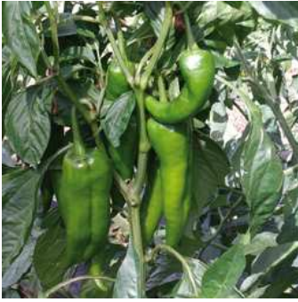
Peperone, pianta e frutti verdi.