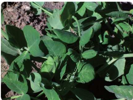
Particolare di pianta di piselli

I piselli nani devono essere rincalzati ad inizio coltura e non necessitano di alcun sostegno. Dopo l'inverno per incrementare la loro crescita è necessario coprire le piante con il tessuto non tessuto bianco. I piselli rampicanti devono essere rincalzati ad inizio coltura, come quelli nani, e necessitano di appositi sostegni (frasche ramificate, reti, ecc.) perché possono raggiungere anche diversi metri di altezza. Esistono varietà semi-rampicanti che raggiungono gli 80-100 cm di altezza.