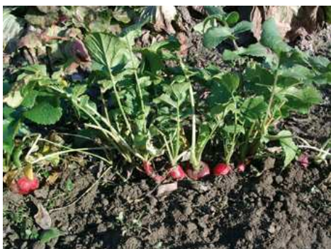
Ravanelli in pieno campo

Il ravanello cresce al meglio su terreni ben drenati, fertili, freschi e sciolti. Sopporta il freddo e teme gli eccessi di caldo. Può essere coltivato tutto l'anno, ma la coltura primaverile e quella autunnale sono da preferire. Come per le rape e le carote, predilige i terreni concimati l'anno precedente.