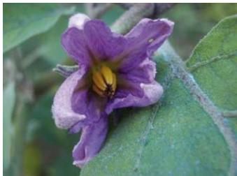
Fiore di melanzana

Viserba, Irene, Violetta, Viola scuro a frutto allungato.