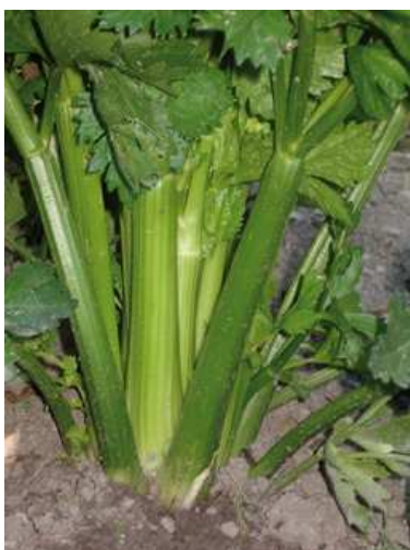
Coste di sedano

Il sedano si coltiva ovunque e si adatta a quasi tutti i terreni. Predilige un terreno profondo, sciolto, permeabile e fresco con PH neutro oppure leggermente alcalino (6,5-7). In esposizione ben soleggiata può essere coltivato anche in alta montagna, purché sia ritirato o protetto con l'arrivo del freddo.