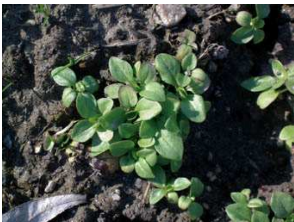
Valerianella a inizio sviluppo

La raccolta a scalare, avviene quando le foglie hanno raggiunto le dimensioni desiderate, a 60-90 giorni dalla semina