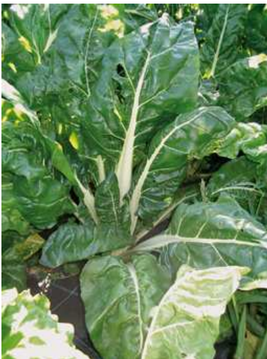
Pianta di bieta a coste

CARATTERISTICHE: è una pianta biennale, il primo anno se ne consumano le coste fogliari e le foglie, mentre nel secondo anno si forma lo stelo fiorale. La bietola a coste ha il fusto erbaceo, grandi foglie di colore verde intenso, con nervature centrali sviluppate, tenere e carnose di colore bianco o tendenti al rosso. Predilige un clima temperato e i terreni di medio impasto, freschi e profondi e senza ristagni d'acqua. Nel sud Italia cresce in pieno campo tutto l'anno senza l'impiego di protezioni.