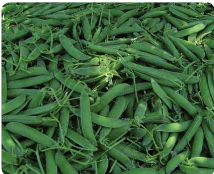
Baccelli di piselli appena raccolti