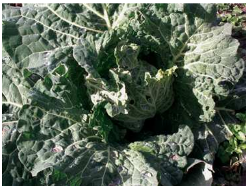
Cavolo verza, inizio formazione testa.

La semina in semenzaio, effettuata in appositi contenitori alveolati, è consigliata da fine giugno a luglio, per permettere il successivo trapianto a dimora da luglio a settembre. La germinazione dei semi avviene rapidamente, dato che le temperature estive sono elevate. È da preferire una situazione ombreggiata nei momenti più caldi della giornata. La semina diretta in campo è possibile, ma poco praticata.