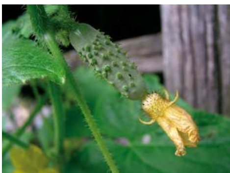
Frutto e fiore di cetriolo

La semina è eseguita ad aprile in semenzaio, in vasetti di torba, oppure direttamente a dimora in postarelle (alcuni semi per ogni buco) dove poi si lascia crescere una sola pianta. Il periodo ottimo per la semina è fine maggio-inizio giugno, quando la temperatura del terreno è sufficientemente calda. Anche il trapianto dei vasetti di torba avviene in questo periodo. Il cetriolo sopporta male il trapianto quindi per far crescere piante più sane è meglio, quando possibile, eseguire la semina diretta in campo. Il sesto di impianto consigliato è di 80-120 cm tra le file e 60-80 cm sulla fila.