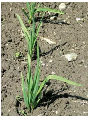
Piante di aglio

Cresce bene su ogni tipo di terreno, anche se predilige quelli limoso-sabbiosi, ben drenati, a reazione neutra o leggermente alcalina, concimati con sostanza organica (letame o compost) l'anno precedente. Per quanto riguarda il clima, preferisce una situazione calda e ben riparata, però sopporta bene il freddo. Quindi, si può coltivare tranquillamente anche in Valle d'Aosta sino a 1800 m d'altitudine.