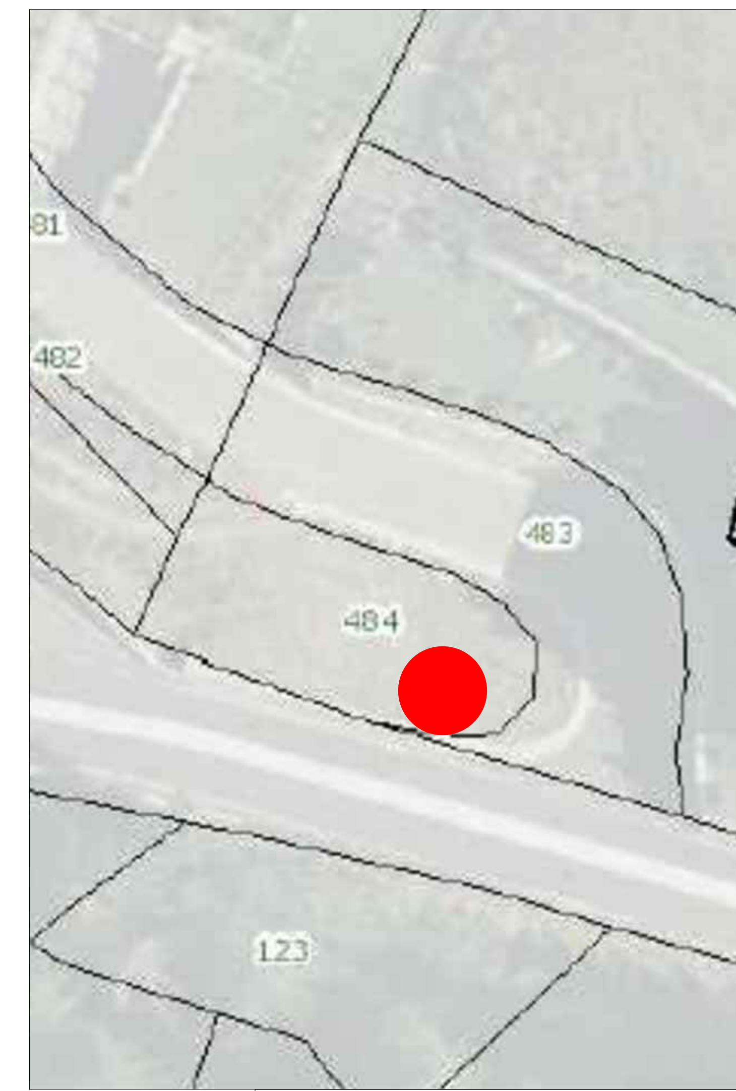
INQUADRAMENTO SU BASE CATASTALE FG 44 (scala 1:200)