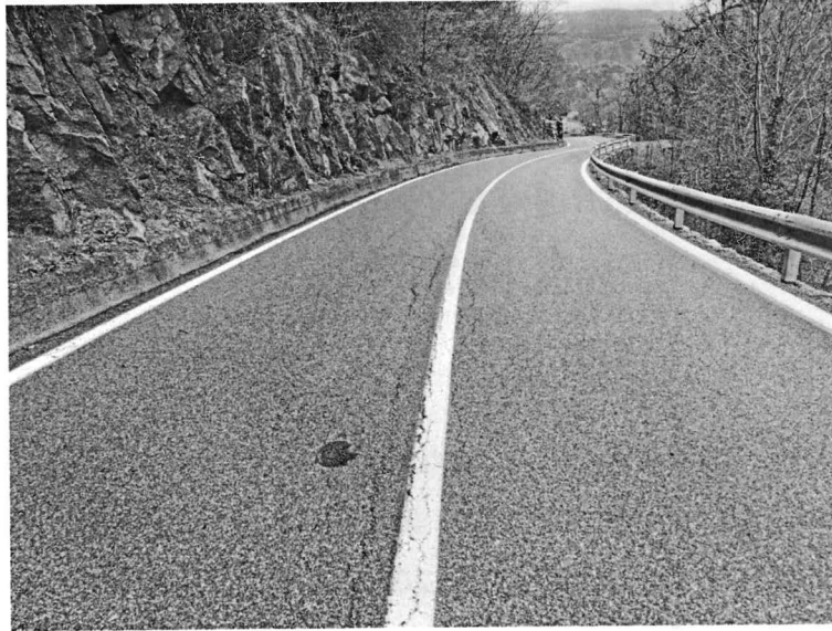
Fig. 1 – Impatto sulla S.R. n. 2.

Il crollo ha riguardato uno o più blocchi che si sono enucleati dalla matrice eluvio-colluviale in cui erano parzialmente inglobati e, precipitando verso valle, hanno interessato sia la strada comunale per la frazione Valeille, sia la S.R. n. 2 all'altezza della progressiva Km 5+000 (fig. 1).