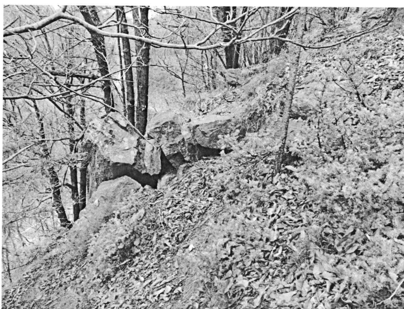
Fig. 3 – Esempio di massi in equilibrio precario.

La causa dell'innescò del fenomeno franoso è da ricondursi alle piogge che hanno interessato la zona nella giornata del 27.02.2024, comportando una parziale saturazione della frazione fine della matrice eluvio-colluviale con conseguente aumento delle pressioni neutre e il contestuale decadimento delle caratteristiche attrittive e coesive della stessa. All'atto del sopralluogo, in corrispondenza della nicchia di distacco, erano presenti alcuni blocchi di dimensione decimetrica posti in equilibrio precario ma che non costituivano un pericolo per la sottostanti infrastrutture comunale e regionale. Tuttavia, lungo tutto il versante interessato dal canale di scorrimento dei blocchi, e lateralmente ad esso, sono state rinvenute diverse situazioni di potenziale pericolo dovute alla presenza di blocchi posti in condizioni di equilibrio precario, da cui potrebbero originarsi ulteriori crolli per effetto di rialzi termici tipici della stagione in corso e di ulteriori piogge, con il pericolo che ne deriva per le sottostanti viabilità regionale e comunale (fig. 3).