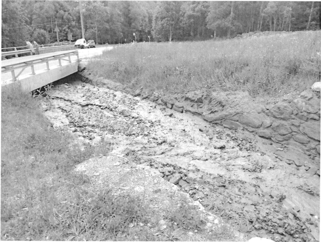
Fig 3: foto esemplificativa 1