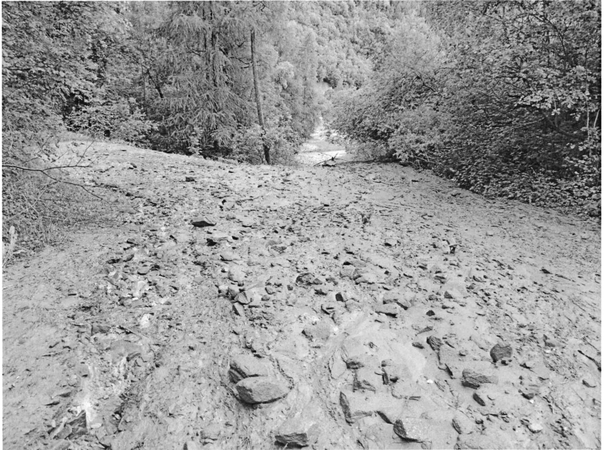
Fig 5: foto esemplificativa 3.