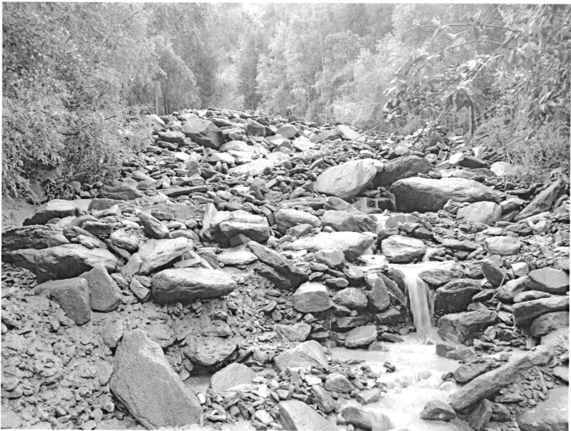
Fig 4: foto esemplificativa 2.