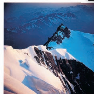
LORENZINO COSSON I COLORI DEL MONTE BIANCO