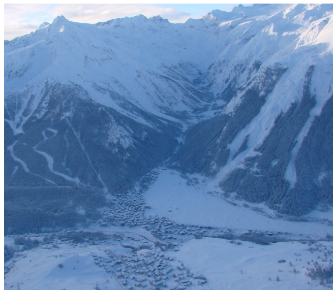
Cogne: il panorama dei prati di Sant'Orso trasformato dal passaggio della valanga 052 ben visibile sulla destra