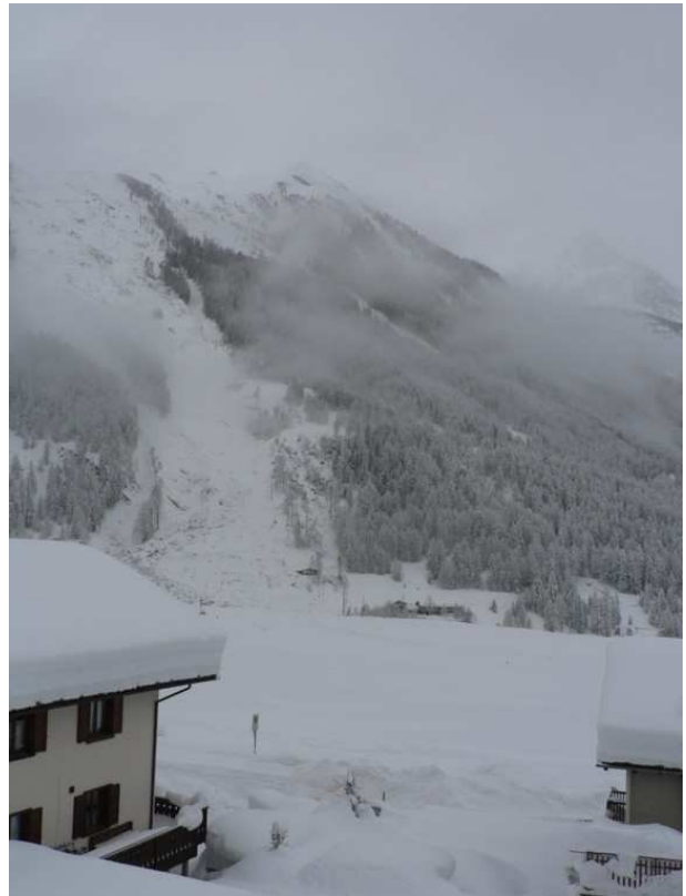
Cogne: il versante nord-est del Mont-Herban (3002 m) dopo la caduta della valanga 052 che ha investito la località Buthier (1560 m)