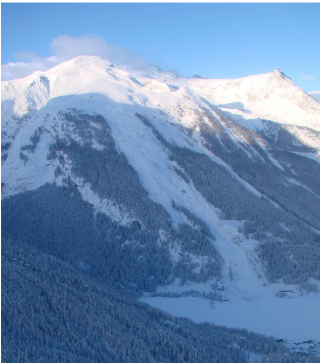
Cogne: il versante nord-est del Mont-Herban (3002 m) trasformato dal passaggio della valanga 052