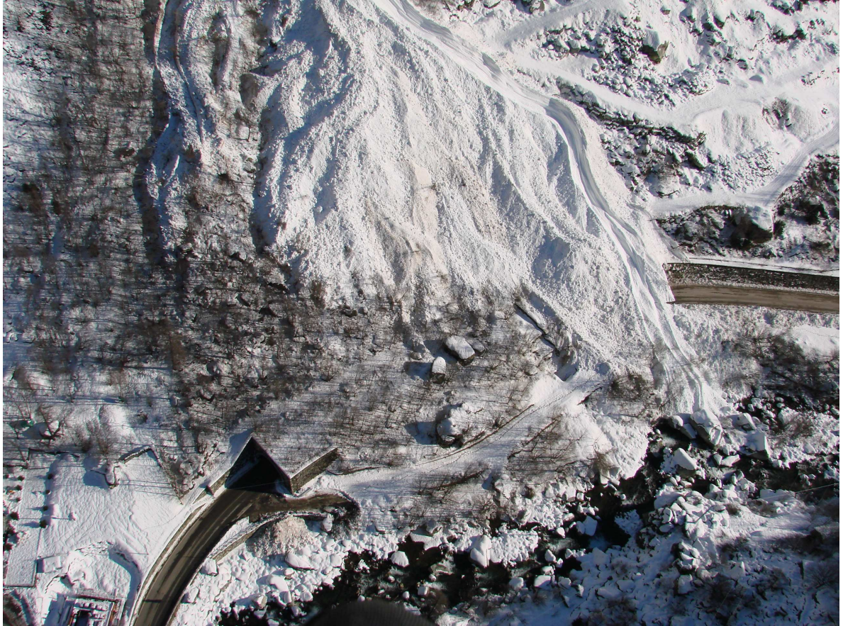
Gaby: la valanga 029 sulla galleria paravalanghe di Bounitzon (1102 m)