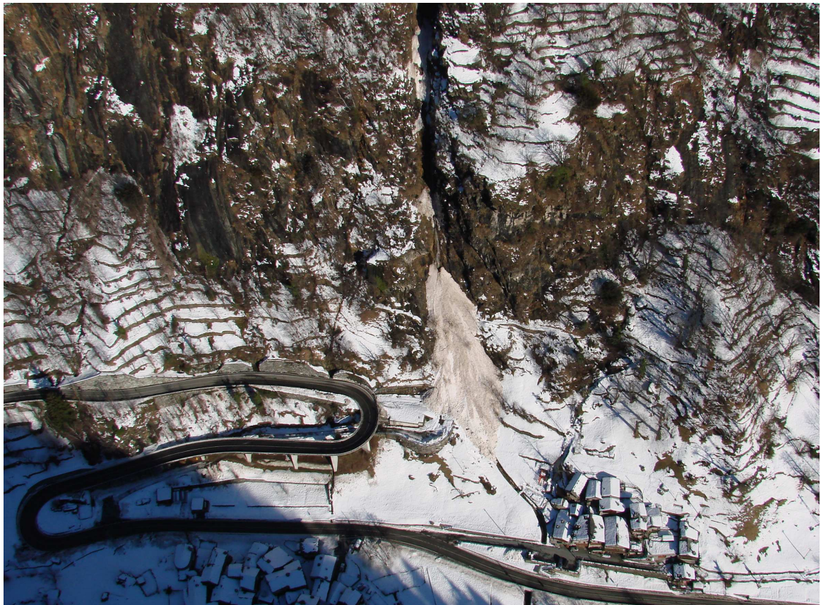
Pontboset: la valanga 009 in prossimità dell'abitato di Trambesère (882 m) e della S.R. n. 2 di Champorcher