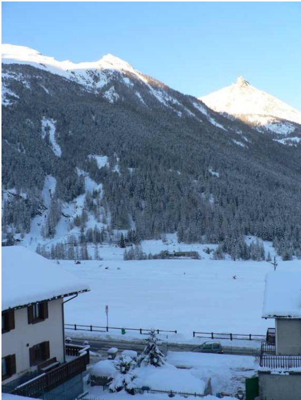
Cogne: il versante nord-est del Mont-Herban (3002 m) prima della valanga