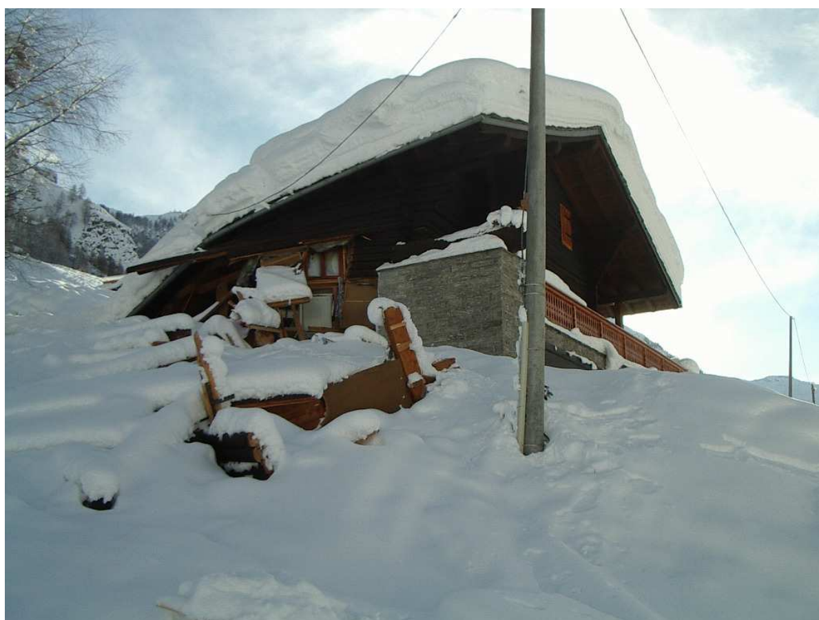
Valsavarenche: una delle abitazioni danneggiate presso la frazione Les Thoules (1570 m)