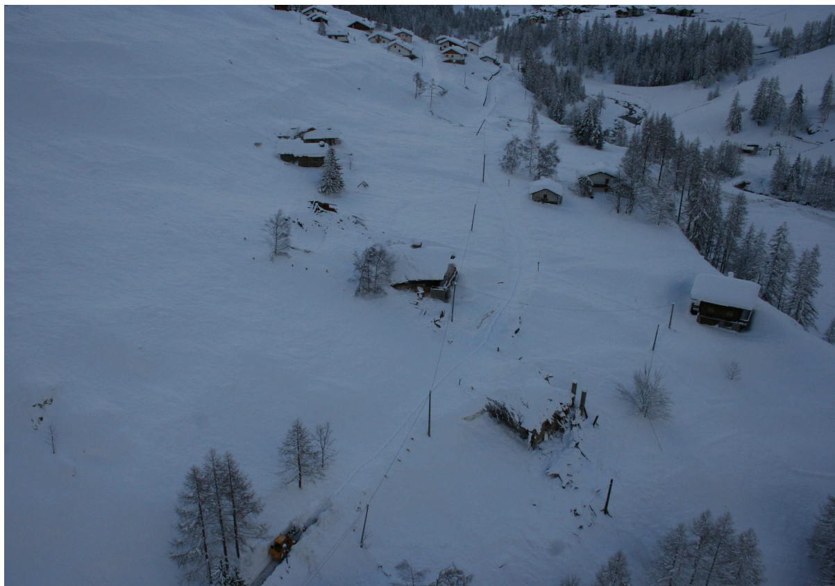
Valsavarenche: la frazione Les Thoules (1570 m) investita dalla valanga n. 039