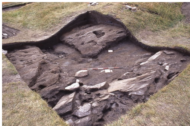
3. Saggio all'angolo nord-est. (M. Girardi)

Anche se i dati emersi nel corso degli scavi non consentono di interpretare la funzione dell'impianto, l'assenza di manufatti posteriori all'epoca romana ed il ritrovamento in ogni settore di elementi riconducibili a questo periodo, suggeriscono che l'opera incompiuta sia stata realizzata nel corso della tarda antichità.