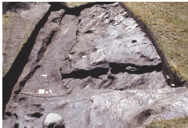
4. Saggio all'angolo sud-est. (M. Girardi)