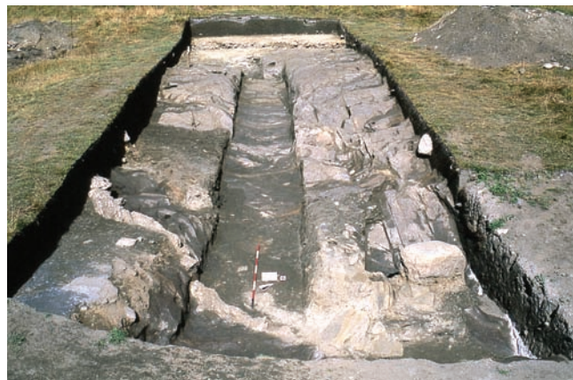
2. Saggio lungo il lato occidentale. (A. Zambianchi)