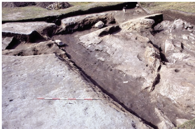
1. Saggio all'angolo sud-ovest. (M. Girardi)

Non è stato identificato il punto nel tratto mediano del lato settentrionale in cui avveniva la ripresa del cavo infatti nel sondaggio realizzato nel 2004, attraverso la porzione nord occidentale del vallo, non sono state trovate tracce di taglio artificiale.