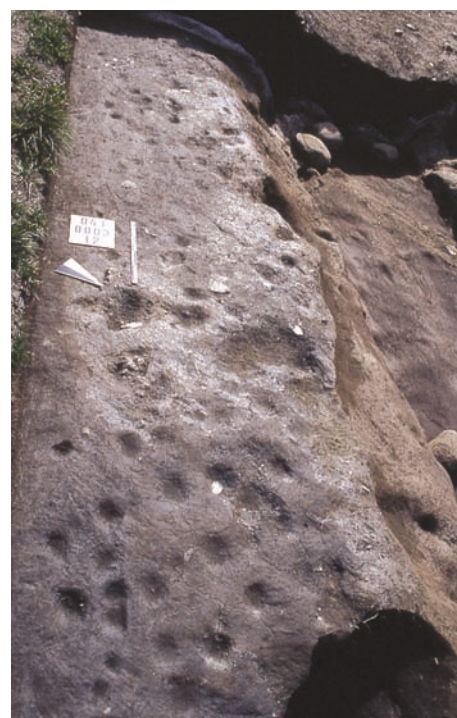
5. Saggio lungo il lato sud, impronte nel limo. (M. Girardi)