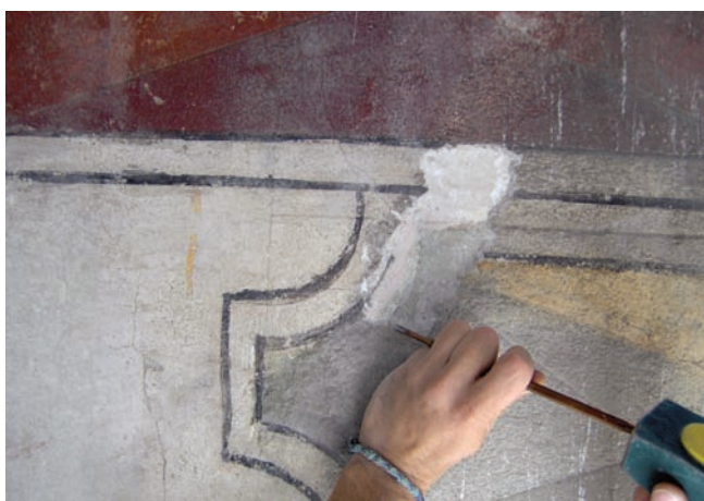
9. Rimozione di una reintegrazione sui conci meridionali.

con le scene dei santi, la superficie era notevolmente abrasa mentre nella metà superiore le superfici erano ricoperte da depositi incoerenti di particolato atmosferico. L'unica zona che aveva subito un intervento di reintegrazione di tipo mimetico era localizzato lungo lo spigolo meridionale, su alcuni conci dipinti; la reintegrazione si differenziava per la tipologia della malta impiegata, di granulometria più grossolana (fig. 10).