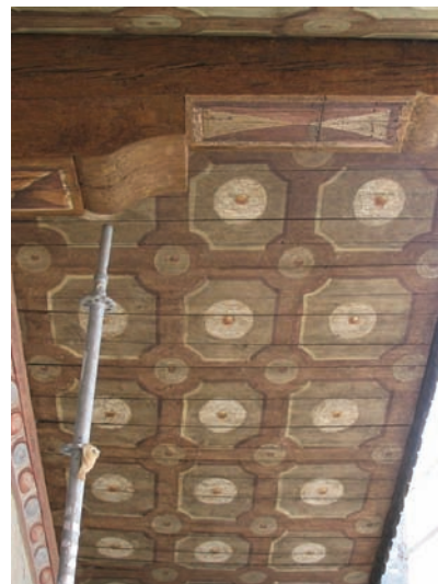
c) Dopo il restauro. (D. Costantini)

grazione delle superfici dipinte. Eseguita con tecnica ad acquerello, realizzata sulla superficie dell'intonaco abraso (fig. 16), la reintegrazione si è potuta avvalere del confronto con le fotografie scattate negli anni Settanta del secolo scorso. Nelle parti basse della facciata, dove i fenomeni fisico-chimici avevano provocato la perdita completa delle decorazioni intorno ai portali e lungo le due estremità della facciata (fig. 17), si è dapprima ricreata una superficie conforme a quella originale, un intonachino molto fine e chiaro, su cui sono state riprodotte le decorazioni ad imitazione mimetica di quelle esistenti. Le scelte attuate dalla direzione scientifica, oltre all'obiettivo prioritario della conservazione del manufatto, hanno consapevolmente individuato nell'integrazione cromatica delle decorazioni dipinte l'obiettivo da perseguire per restituire l'unitarietà di lettura del complesso programma iconografico.