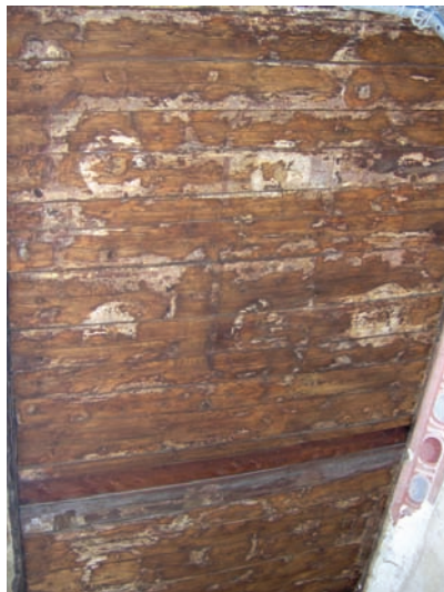
b) Dopo la pulitura e il consolidamento. (M. Bagagiolo)