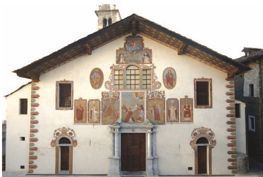
1. La facciata al termine dell'intervento di restauro. (G.F. Lovera)

La lettura delle iscrizioni è stata possibile grazie alla conservazione della parte bianca del fondo delle iscrizioni che scontorna le lettere, di cui si conservavano solo poche tracce di colore originale, rosso. La reintegrazione cromatica ha riguardato prima la definizione del fondo chiaro e successivamente quella dei caratteri. Nelle zone in cui non