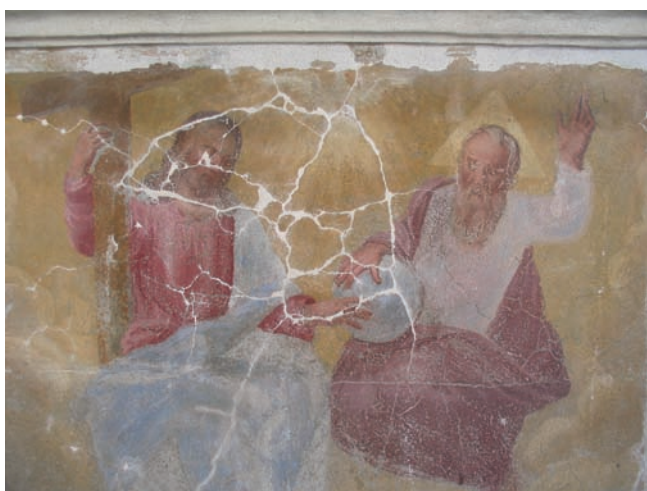
13. La Trinità in fase di restauro. (D. Costantini)

L'ossidazione del ferro all'interno di una pietra della muratura aveva provocato il rigonfiamento di una porzione d'intonaco dipinto, in corrispondenza della raffigurazione della Trinità, nella scena centrale. Un intervento localizzato di stacco ne ha reso possibile il risanamento (figg. 12-14). Ristabilita quindi la coesione tra i materiali ed effettuata la stuccatura delle discontinuità superficiali si è proceduto con la rimozione dei depositi sui dipinti e con la rimozione a bisturi della sovrapposizione di scialbature dai fondi neutri della facciata. La scelta progettuale della rimozione è stata determinata dalla migliore qualità materica dello strato