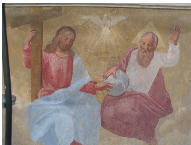
14. La Trinità dopo il restauro. (D. Costantini)

Ma i problemi che destavano maggior preoccupazione per la conservazione dei dipinti erano rappresentati dai fenomeni di decoesione superficiale degli intonaci, accompagnati dalla caduta diffusa della pellicola pittorica, degrado che si manifestava soprattutto nella metà inferiore della facciata. In seguito di una fase di sperimentazione di nuove metodologie (vedasi a questo proposito infra pp. 214-217) si è optato per un consolidamento di tipo minerale esteso a cui è seguito l'intervento di reinteg-