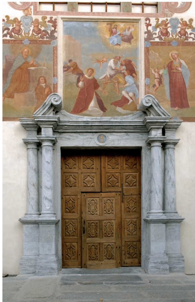
19. Il portale dopo il restauro. (M. Bagagiolo)