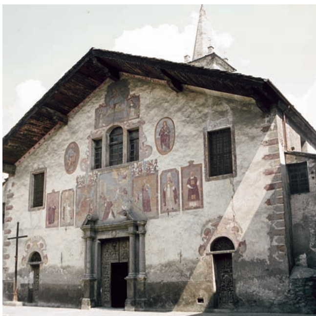
6. La facciata in una fotografia degli anni '70 del Novecento.

Lo stato di conservazione dell'insieme degli eterogenei elementi decorativi della facciata, era particolarmente compromesso: le lacune e l'alterazione superficiale delle decorazioni sul supporto ligneo, la stratificazione di consistenti depositi lungo le aree protette dalla sporgenza del tetto, l'erosione degli strati pittorici dei registri inferiori, il disgregarsi degli intonaci nella parte bassa, la sovrapposizione di sostanze sul portale, determinavano rapporti falsati tra le cromie, alterando l'immagine complessiva