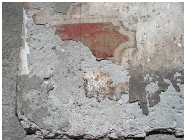
17. Stato di conservazione degli intonaci nella parte inferiore. (D. Costantini)