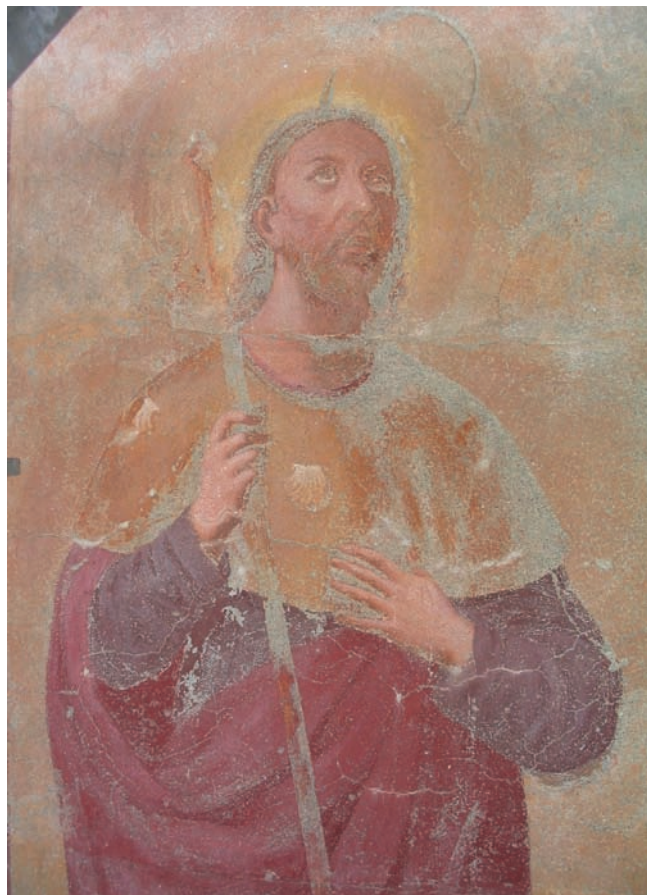
10. San Giacomo Maggiore prima della reintegrazione. (D. Costantini)

Per l'esecuzione degli interventi di restauro la ditta appaltatrice Edilrestauri di Altavilla Vicentina si è avvalsa della collaborazione della società cooperativa De La Ville di Aosta.