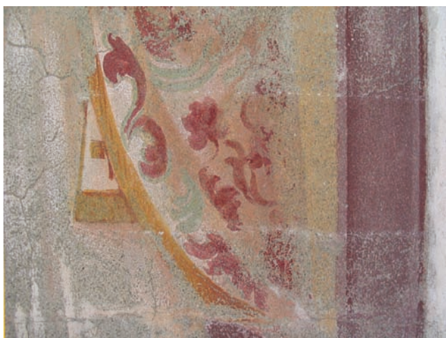
16. Prova di reintegrazione cromatica. (D. Costantini)

Le operazioni di restauro hanno restituito una lapide di epoca romana, inserita all'interno del piedritto nord del portale maggiore e occultata dalla lesena sinistra del portale (fig. 22), ora rimossa e in fase di studio. Una lastra in bardiglio liscia, murata sul lato nord della facciata, è stata coperta dai nuovi intonaci avendo preventivamente verificato l'assenza di lavorazioni sul lato interno.