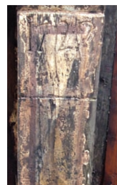
2. La data incisa sulla trave di colmo del tetto. (D. Costantini)