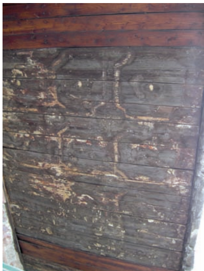
15. La superficie lignea: a) prima del restauro. (M. Bagagiolo)