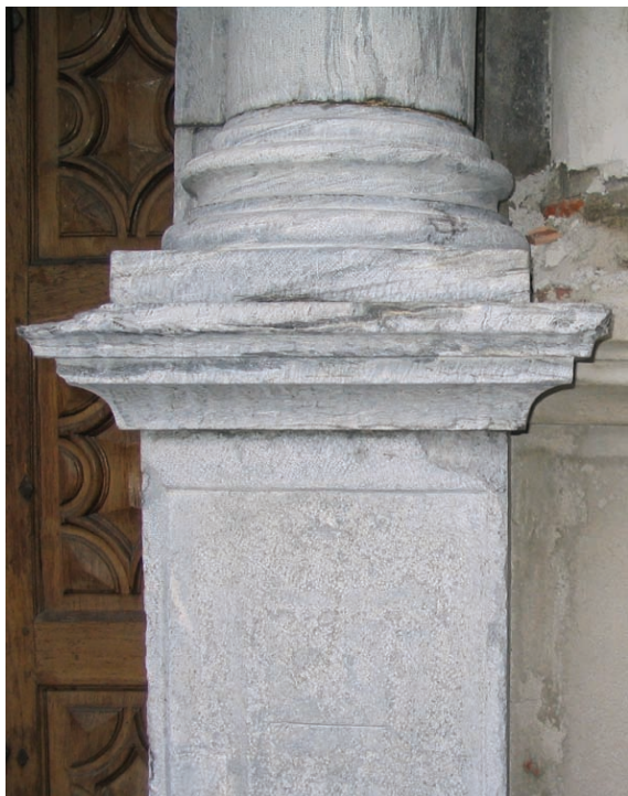
21. Particolare degli elementi di destra del portale durante il restauro. (D. Costantini)