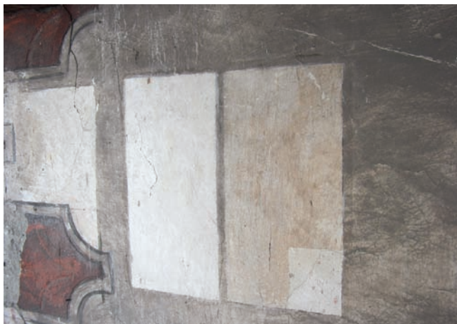
8. Rimozione degli strati soprammessi al fondo neutro nella parte superiore della facciata. (P. De Girolami, Edilrestauri)