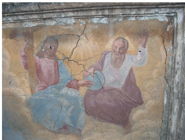
12. La Trinità prima del restauro.

La prima fase dell'intervento di restauro, effettuate la preliminare documentazione fotografica e la calibratura dei sistemi di pulitura sulle diverse superfici, ha dato priorità alle operazioni di preconsolidamento, laddove persisteva il pericolo di perdita di frammenti, e all'intervento di consolidamento dei difetti di adesione tra gli strati di intonaco, lungo le fessurazioni in profondità con funzione riempitiva, per conseguire la continuità materica interna.