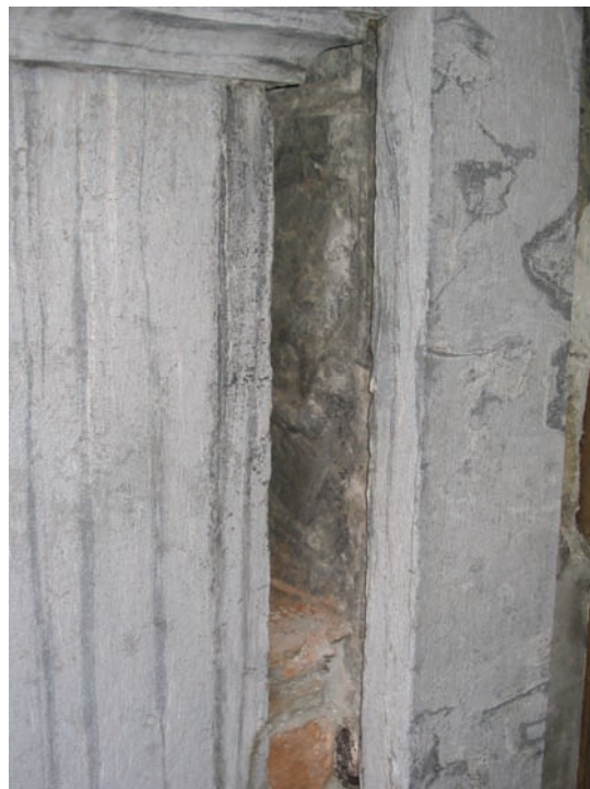
22. Particolare dello scoprimento della lapide di epoca romana inglobata nel piedritto nord del portale centrale.