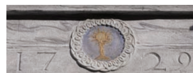
3. La data scolpita sull'architrave del portale. (M. Bagagiolo)