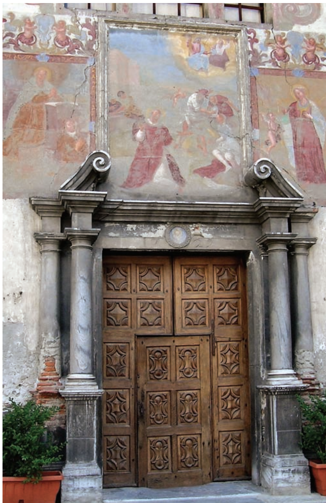
18. Il portale prima del restauro. (M. Bagagiolo)