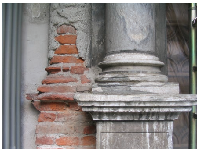
20. Particolare degli elementi di sinistra del portale prima del restauro.

*Restauratrice I.C.R., collaboratrice esterna con funzione di direttore operativo.