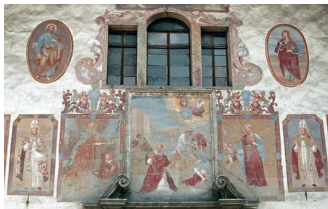
7. Dipinti del registro mediano in una foto degli anni '70 del Novecento.

Estremamente diversificato si presentava lo stato di conservazione della pellicola pittorica dei dipinti con un degrado gradualmente più accentuato dall'alto verso il basso, raggiungendo nel registro inferiore la perdita completa di parte delle decorazioni. Nel registro mediano,