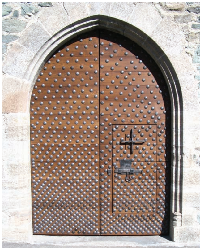
4. La copia collocata in opera. (R. Ferrod)