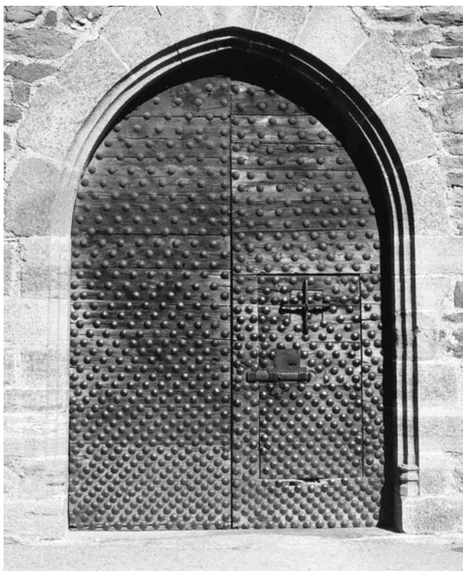
3. Il portone prima della sostituzione. (P. Fioravanti)