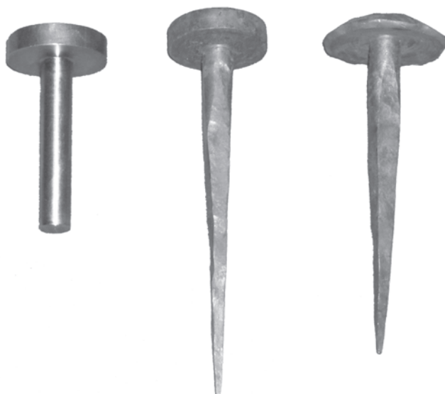
5. Le tre fasi di lavorazione degli oltre mille chiodi forgiati a mano. (R. Ferrod)