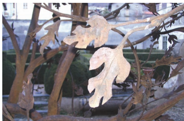
2. Elemento originale della fontana del melograno. (R. Ferrod)