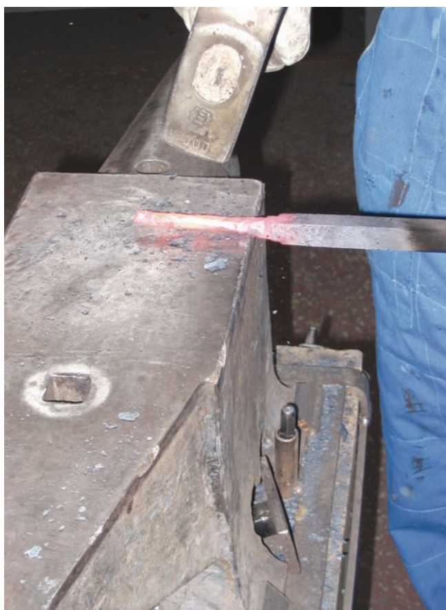
1. Forgiatura (realizzata nell'officina meccanica della Soprintendenza) di un elemento della fontana del melograno del castello di Issogne. (R. Ferrod)