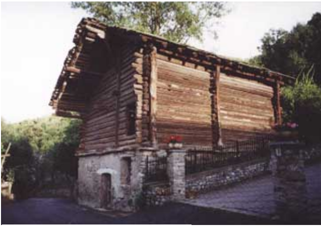
4. Fénis: rascard. (N. Dufour)

L'oggetto della tutela, il bene culturale, sebbene ancora al centro di un serrato dibattito, sembra qui presupporre un referente ideale. Il modello soggiacente all'operazione di confronto proprio della valutazione sembra riferirsi ad una tipologia che, oltre a riconoscere il vincolo dei cinquant'anni imposto per legge, sembra ricondurre ad una tipologia di abitazione tradizionale che ha le sue radici nel mondo rurale. Tale modello, riconosciuto ormai anche da larga parte dell'opinione pubblica, si ritrova nelle opere di carattere più scientifico 13 . La testimonianza materiale di una civiltà, quella contadina del secolo scorso, riassume larga parte delle valenze culturali affermate.