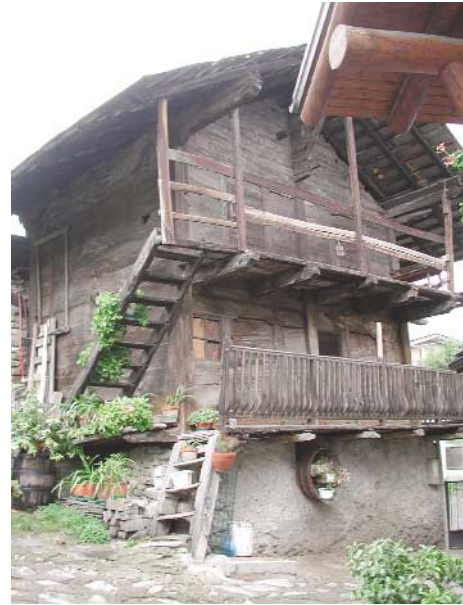
2. Villair di Quart, fraz. Larey: grenier. (N. Dufour)

lato, e dall'altro dalla relazione e dalle norme di attuazione. In particolare è richiesto un elaborato costituito da schede di rilievo (motivazionali) dei fabbricati classificati monumento, documento o di pregio storico, culturale, architettonico, ambientale contenente una documentazione fotografica, un'indicazione della classificazione dell'edificio e l'indicazione e/o elencazione, ove presenti, degli elementi meritevoli di conservazione e/o recupero dal punto di vista volumetrico, dell'organizzazione distributiva, delle strutture, degli elementi stilistici databili, dell'impiego di particolari lavorazioni e/o tecnologie, degli elementi decorativi di particolare rilievo (fig. 2).