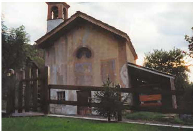
5. Fénis: cappella in fraz. Tillier. (N. Dufour)

such areas. A classification of the historic centres, was enforced, or a normativa di attuazione (normative planning standards of implementation), according to normatively standardized categories. Attention was certainly given to the existing patrimony with an evident interest in protection and preservation, in which the Superintendence has the role of guidance and control of the classification. However, there are many problems involved in doing this effectively: specifying the categories, lack of categories, limited reference from the land office register, difficulty in setting-up a data bank due to the complexity of the means and the number of subjects involved in collecting and managing the information.