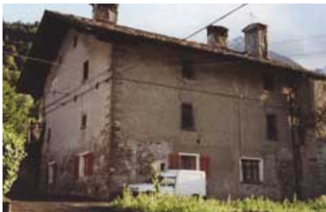
1. Fénis: casaforte Tillier. (N. Dufour)

In Valle d'Aosta è emerso un forte bisogno di tutela generale nel 1960 con la legge regionale n. 3 e con una attenzione ambientale-paesistica a livello urbanistico. In seguito la legge regionale n. 14/78 ha stabilito le norme per la redazione dei Piani Regolatori Generali Comunali che sfornano indicazioni per le zone territoriali di "tipo A". In questo ambito innovativo la Soprintendenza ha abbracciato una linea di tutela volta alla salvaguardia dell'identità fisico-territoriale dei nuclei storici tentando di combattere la nuova edificazione che salda tra di loro gli insediamenti antichi. Nello stesso tempo ha svolto un'azione di tutela sugli edifici significativi all'interno dei nuclei con l'utilizzo di norme restrittive sugli interventi ammessi (fig. 1).