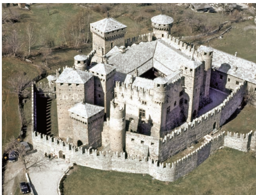
1. Vue du château. (L'Image)

- la "vieille tour" située à l'Ouest de l'entrée se superpose avec son angle Nord-Ouest à une section de l'enceinte intermédiaire qui se développe à partir de cet angle. Quelques bois de la tour ont été datés avec l'analyse dendrochronologique à 1235, période qui remonte à des travaux de construction de la première phase du château. D'autres analyses sur des éléments de bois, qui ont fourni des dates aux alentours de 1897, nous confirment au contraire la période à laquelle furent effectuées les restaurations.