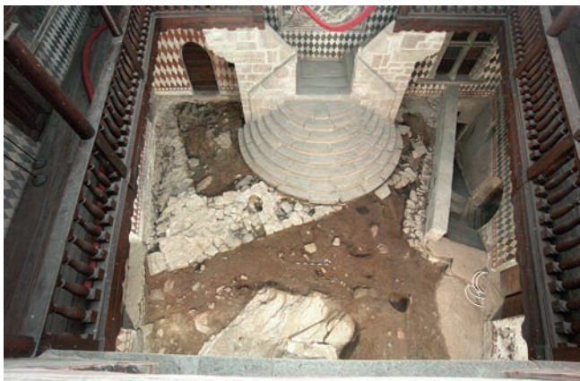
2. Vue générale de la cour une fois les fouilles complétées. (S.E. Zanelli)