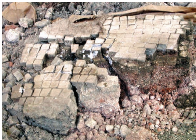
1. Particolare delle fratture. (K. Gianotti)

La prima fase di pronto intervento conservativo in situ ha previsto la stabilizzazione del tessellatum mediante una garzatura (facing) , fatta aderire alla superficie con una resina vinilica in soluzione alcolica, compatibile con l'acqua che impregnava le porzioni di mosaico. Questa operazione ha consentito di mantenere unite ed in posizione le tessere, soprattutto in corrispondenza dei profili del tessellatum . La forte presenza di acqua di im p r e g n a z i o n e n o n c o n s e n t i v a a l c u n t i p o d i consolidamento dello strato musivo rispetto al substrato di malta. Pertanto, ad ogni porzione è stato applicato un bendaggio di contenimento (fig. 2).