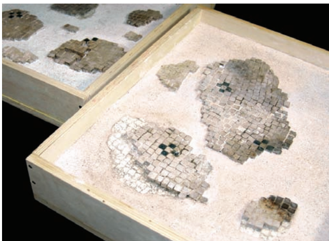
4. Presentazione finale delle porzioni di mosaico. (K. Gianotti)

In assenza di precisi riferimenti ci si è limitati a ricondurre le porzioni di mosaico ad un unico ipotetico piano pavimentale. Tuttavia, laddove gli stessi motivi decorativi hanno suggerito una disposizione geometrica, è stata proposta una ricomposizione ragionata. L'intervento,