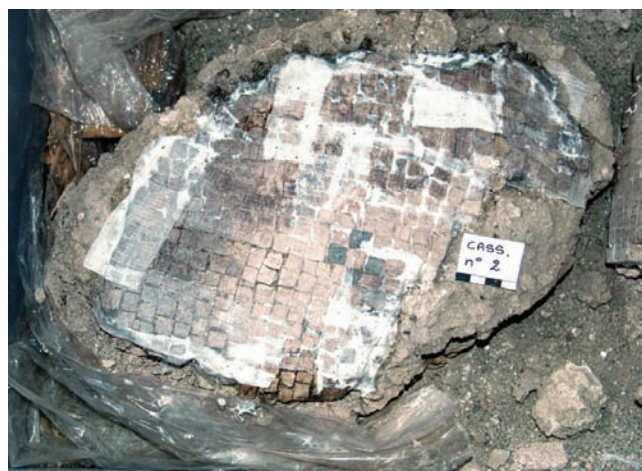
2. Garzatura e bendaggio di contenimento. (K. Gianotti)

Solo successivamente, esse sono state staccate dal terreno "in blocco" (parzialmente inglobate nel terreno di crollo) e collocate su un allettamento provvisorio di sabbia, all'interno di appositi contenitori per l'imballaggio e il trasporto.