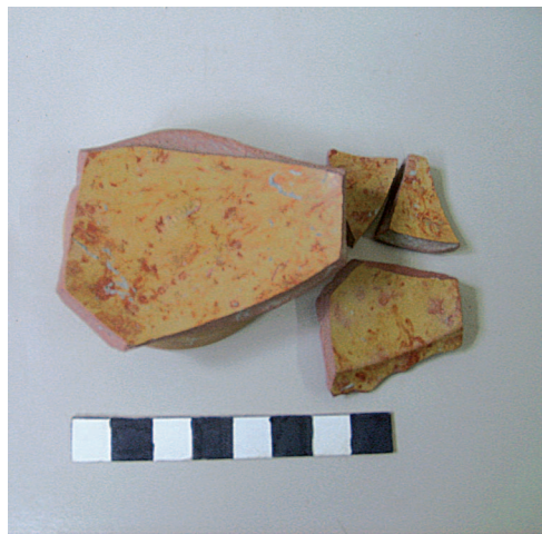
7. Frammenti di coppa in Terra sigillata marmorizzata. (L. Rizzi)

Fondamentale si è rivelato, invece, lo studio tipologico della ceramica. Ben rappresentata la ceramica comune con forme da mensa e da fuoco; presenti anche la Terra sigillata italiana, gallica e, in minima parte, africana, la sigillata tarda/CRA, la ceramica indigena e sovradipinta La Tène finale, l'imitazione della Campana B, le Pareti sottili, la marmorizzata (fig. 7) e l'invetriata con forme tipiche del repertorio da mensa. Da segnalare, inoltre, il rinvenimento della ceramica a rivestimento rosso interno, paragonabile al moderno antiaderente, i cui frammenti appartengono a tegami.