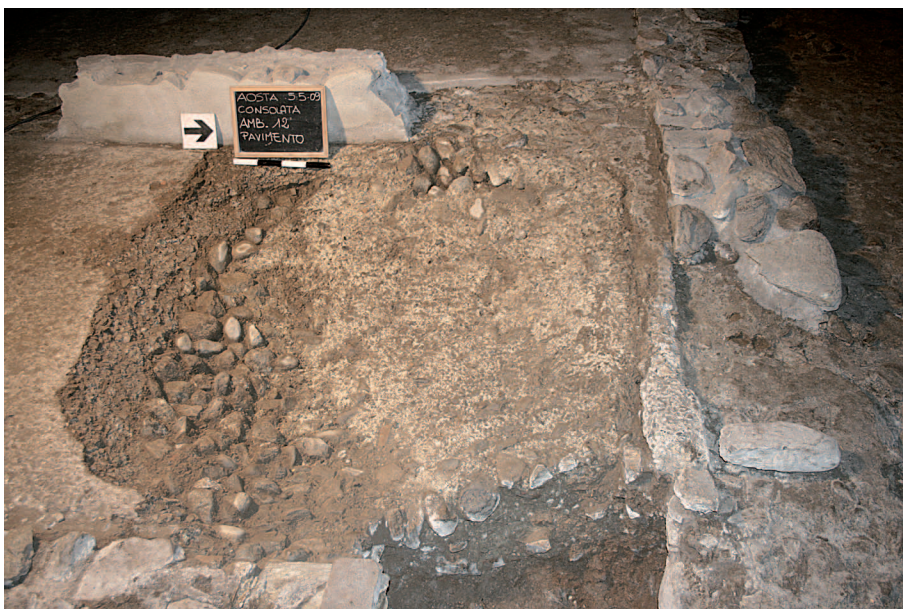
4. Pavimento in cementizio del vano 12. (A. Armirotti)