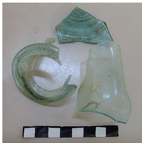
8. Frammenti di orlo, parete e fondo di una bottiglia quadrata ISINGS 51 a/b. (L. Rizzi)

I frammenti di intonaco rinvenuti in particolar modo nei vani termali, nei cubicula e in alcuni vani di deambulazione, hanno inoltre permesso di ipotizzare come si potessero presentare i rivestimenti parietali di tali ambienti: decorazione a fasce e pannelli di diversi colori (rosso pompeiano, bianco, senape, verdino, azzurrino, rosa pallido) che volevano emulare paramenti in marmo e pietre dure diverse, secondo lo stile pompeiano delle prime fasi.