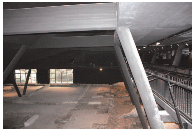
1.-2. Sistemazione attuale del sito. (S. Bertarione)