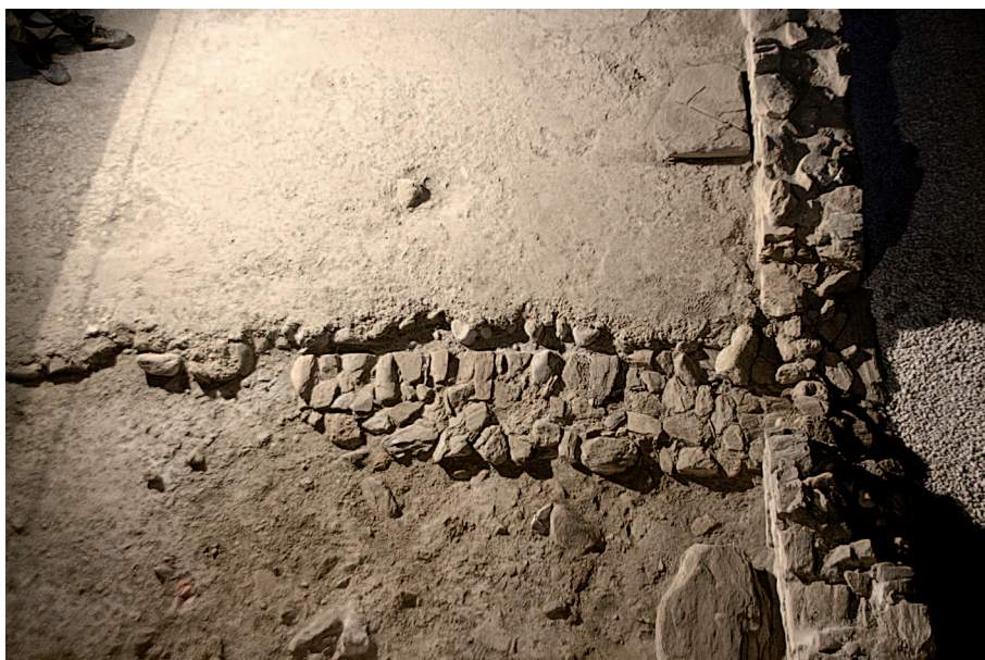
5. Struttura muraria est-ovest che divide la parte nord da quella sud dell'horreum. (A. Armirotti)