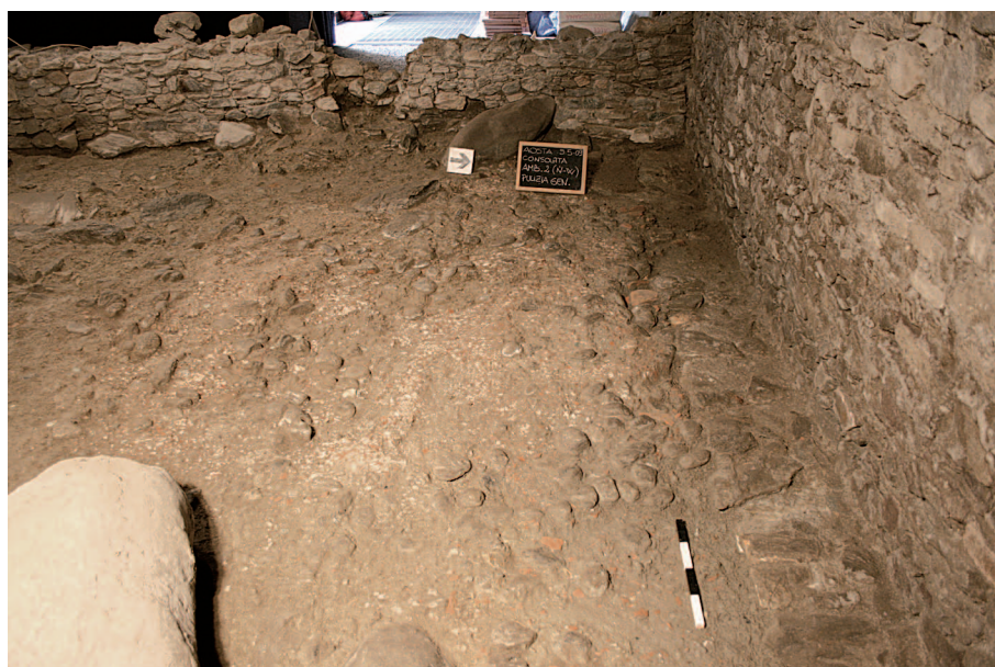
6. Rilegna di fondazione del muro perimetrale nord della villa. (A. Armirotti)