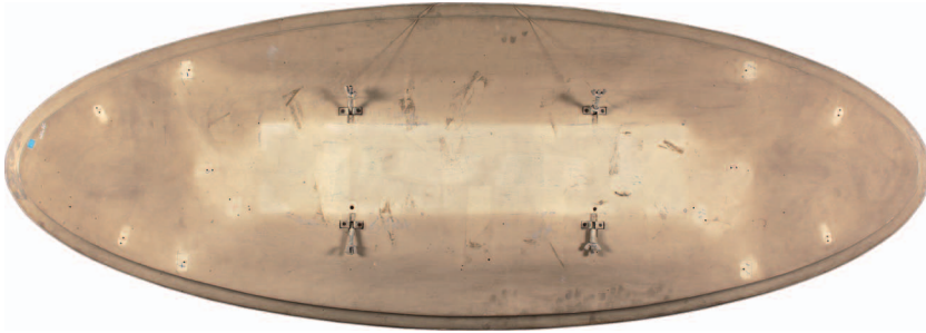
2. Verso prima del restauro. (P. Rosetta)