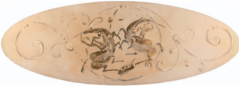
1. L'opera prima del restauro. (P. Rosetta)