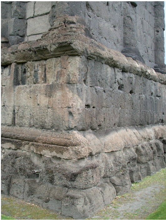
2. Particolare del degrado delle facciate ovest e sud.

In questa seconda fase sono stati pertanto aggiunti, al di sotto della volta stessa, quattro nuovi gruppi di sonde di tipo temperatura e umidità e un anemometro sonico. Inoltre, sul tetto, sono stati posizionati un ulteriore anemometro sonico e un anemometro a coppette 2 associato ad un termoigrometro. Quest'ultimo è stato posizionato sul tetto ad un'altezza tale da ottenere delle misure, per quanto possibile, non perturbate dalla presenza degli edifici circostanti.