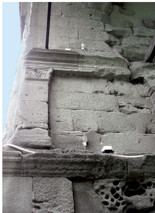
3. Sensori per l'acquisizione di temperatura e umidità posizionati sotto la volta del monumento. (D. Ponziani)

Infine, le misure microclimatiche acquisite nell'area del monumento sono state confrontate con i rilevamenti di centraline meteorologiche presenti sul territorio, di proprietà dell'ARPA (Agenzia Regionale per la Protezione dell'Ambiente) e della Protezione Civile. Il confronto è stato utile in primo luogo per validare i dati acquisiti dalla strumentazione posta sull'Arco d'Augusto ed inoltre per