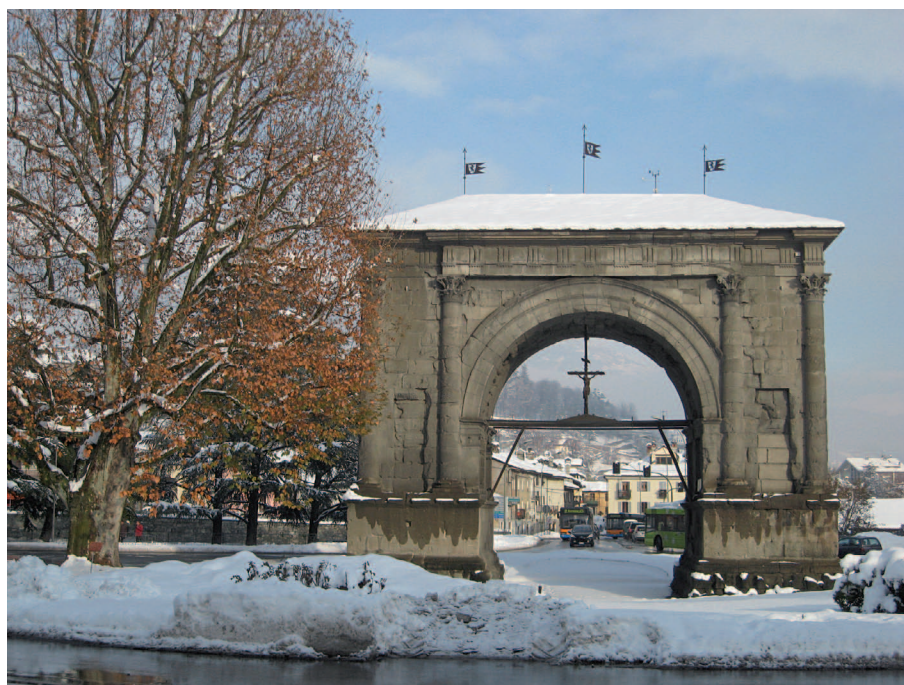
1. L'Arco di Augusto. (D. Ponziani)

Dopo un primo periodo di acquisizione e valutazione dei dati, si è ritenuto opportuno un approfondimento che risolvesse alcune tematiche conoscitive, in particolare per quanto concerne la situazione della volta interna.