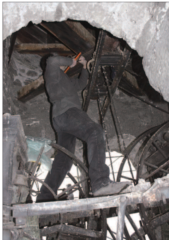
4. Les prélèvements dendrochronologiques exécutés au moyen d'une sonde finlandaise dans les bois de la flèche. (G. Sartorio)

Pour ce qui est de l'intérieur de la structure (fig. 3), l'analyse dendrochronologique a permis de dater avec précision les premier, troisième et quatrième paliers de l'escalier conduisant à la chambre des cloches actuelle, tous situés en dessous de la ligne de surélévation du clocher, déjà citée plusieurs fois. 9 Les carottes de bois récupérées grâce