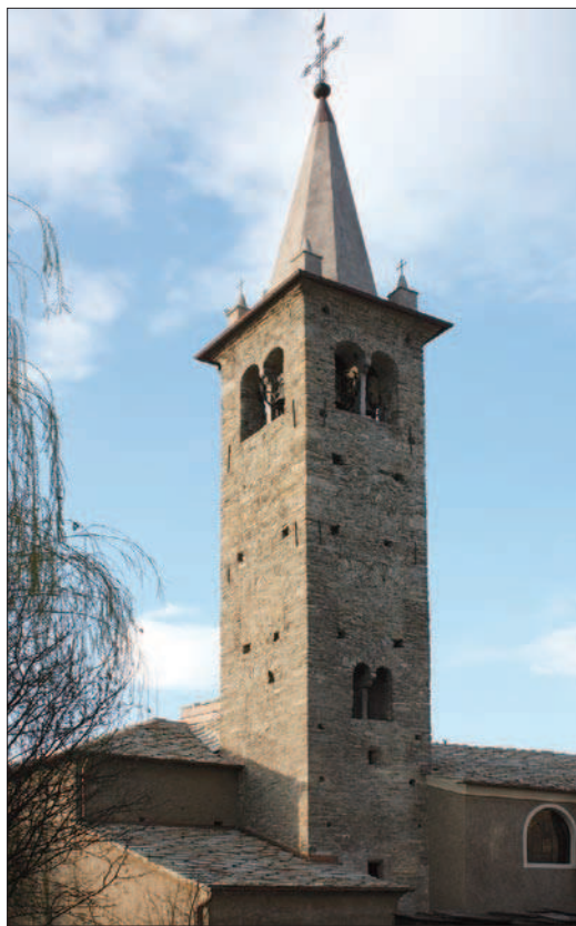
1. Le clocher de l'église Saint-Étienne vu du Nord-Est. (G. Sartorio)

Dans le cas des interventions d'entretien extraordinaire du clocher de l'église Saint-Étienne (fig. 1), ce sont justement les échafaudages montés pour atteindre la flèche de la structure qui ont fourni le prétexte pour l'approfondissement d'investigations destinées à confirmer ou à infirmer les données connues jusqu'ici sur l'histoire de la tour. D'après les sources d'archives et en particulier des visites pastorales, en 1414 « campanile fit novum et iam alte usque ad capum ». 1 Comme l'avait déjà noté Bruno Orlandoni, cette information situe parfaitement l'édification de la nouvelle tour du clocher au début du XV e siècle, simultanément à la construction d'une série de clochers