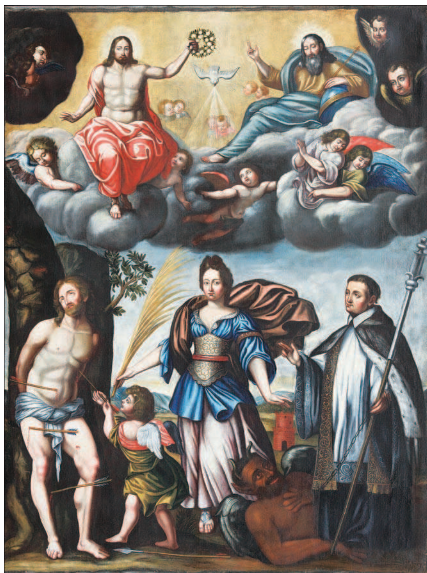
3. La pala al termine del restauro. (S.E. Zanelli)