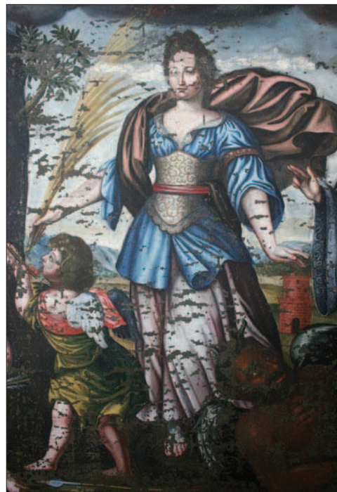
2. Santa Barbara durante l'intervento. (N. Cuaz)