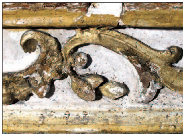
4. Les repeintures de Guala ne respectent pas les couleurs d'origine. (S. Pulga)

Dans son repeint, assez grossier, Guala a utilisé des tons pastels très différents des couleurs d'origine, basés sur un fond de rouges et de bleus sur lequel se détachaient la dorure, l'argenture, et des surfaces laquées en vert et en garance (fig. 4).