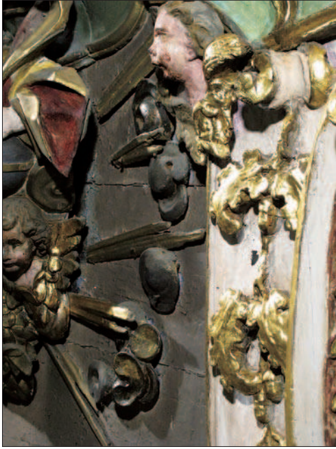
9. Le nettoyage souligne combien l'autel était couvert de dépôts et de noir de fumée. (S. Pulga)

Les zones vermoulues ont été préventivement traitées avec du Permetar™, consolidées avec du Paraloid B -72 (5% P/V en toluène) et mastiquée avec de la résine à deux composants Balsite™.