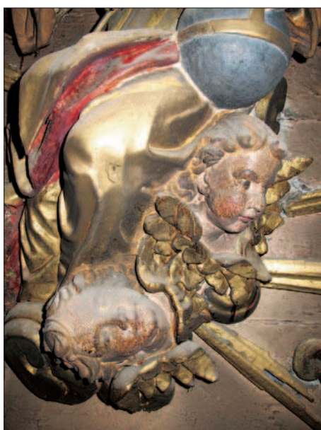
7. Bien que ternie par les dépôts et par les particules, la dorure d'origine est parfaitement brunie. (S. Pulga)

Une autre phase « d'entretien », remontant probablement à la première moitié du XX e siècle, a consisté en un grossier masticage des craquelures et en une irrégulière et épaisse couverture au pinceau de nombreuses surfaces avec de la résine jaunâtre (probablement du copal), qui s'est ensuite oxydée jusqu'à devenir orange ou brune (fig. 5). Enfin, à une époque récente, vers 1965 au dire du curé, les parties basses ont été repeintes avec des vernis dorés là où la dorure était très usée ou même tombée (fig. 6). Le noir de fumée avait considérablement terni et obscurci l'autel dans son ensemble, les parties basses étaient maculées d'éclaboussures de cire et de peinture, la corniche de la mensa était fortement vermoulue. À noter également de nombreux soulèvements de la dorure (fig. 7).