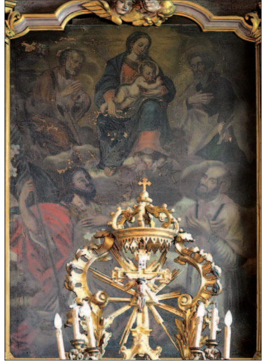
10. La toile avant l'intervention. La pellicule de peinture est tombée à plusieurs endroits et l'ensemble est noirci. (S. Pulga)

On peut de même attribuer à Guala une intervention désastreuse au revers du tableau, réalisée à l'aide de