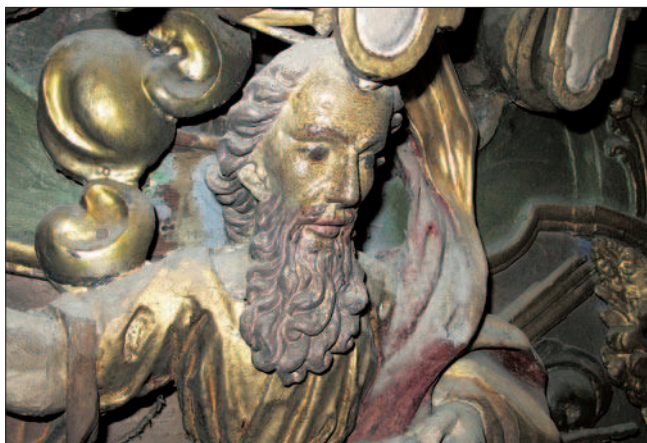
5. L'aspect de la structure en bois est radicalement altéré par les dépôts de poussière et par les vernis oxydés.