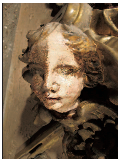
8. Essai de nettoyage pour ôter les vernis oxydés. (S. Pulga)

Suivant les indications ci-dessus, le nettoyage a entièrement été exécuté à l'aide de petits tampons d'ouate (fig. 9).