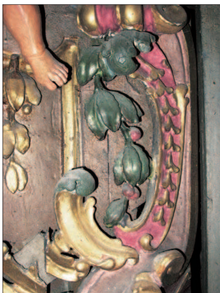
6. Dans les parties basses, la dorure très usée ou tombée était repeinte au vernis doré. (S. Pulga)