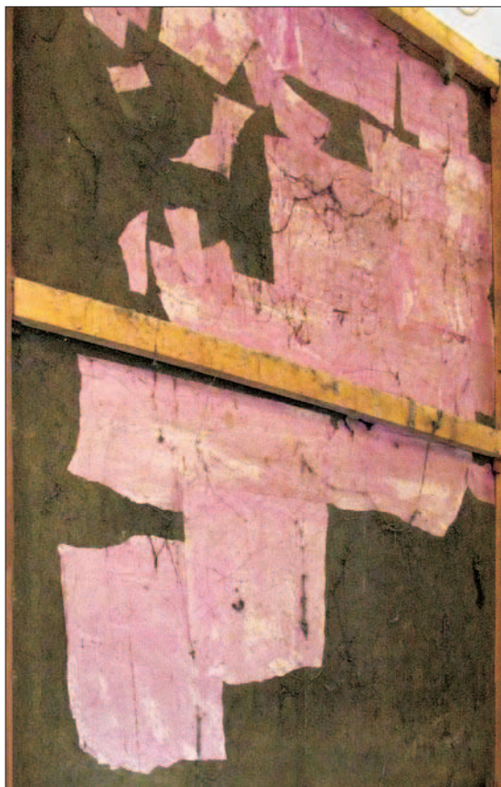
13. Le revers de la toile tout juste extraite de sa niche. Les pièces de carton utilisées par Guala pour « arrêter » les lacérations sont mises en évidence. (S. Pulga)