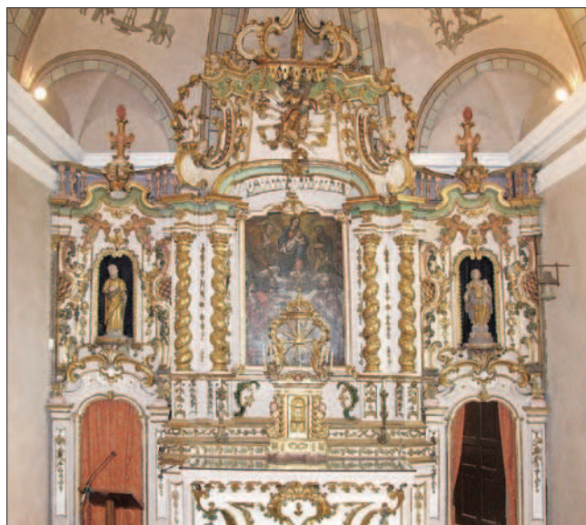
1-2. L'autel avant et après la restauration. (S. Pulga)