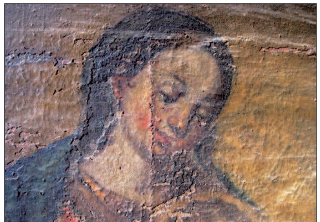
12. Après un léger nettoyage préliminaire, des repeintures apparaissent ; elles peuvent être attribuées à Guala et elles sont exécutées à l'huile directement sur la toile laissée découverte depuis le détachement de l'ensemble préparation/pellicule picturale. (S. Pulga)