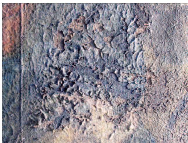
14. Macrophotographie des soulèvements causés par les excès de colle et de vernis. (S. Pulga)

morceaux de carton violet (le même qui avait été utilisé pour colmater les fissures du couronnement) fixés avec de la colle de menuisier. Dans ce cas aussi, l'excès de colle et son fort pouvoir adhésif ont causé des tractions et des contractions qui ont aggravé l'état de conservation général. L'adhérence à la toile de l'ensemble formé par la préparation (très fine, de couleur orange) et par la pellicule picturale était plus faible que celle des collages faits par Guala au revers, qui ont donc provoqué des lézardes et des soulèvements à l'évolution typiquement concentrique (fig. 14).