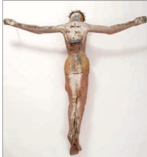
1-2. La scultura prima del restauro. (G. Lovera)