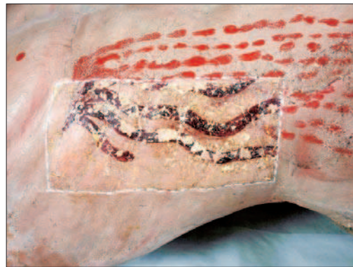
4. Rimozione degli strati di ridipintura sul costato del Cristo. (G. Lovera)