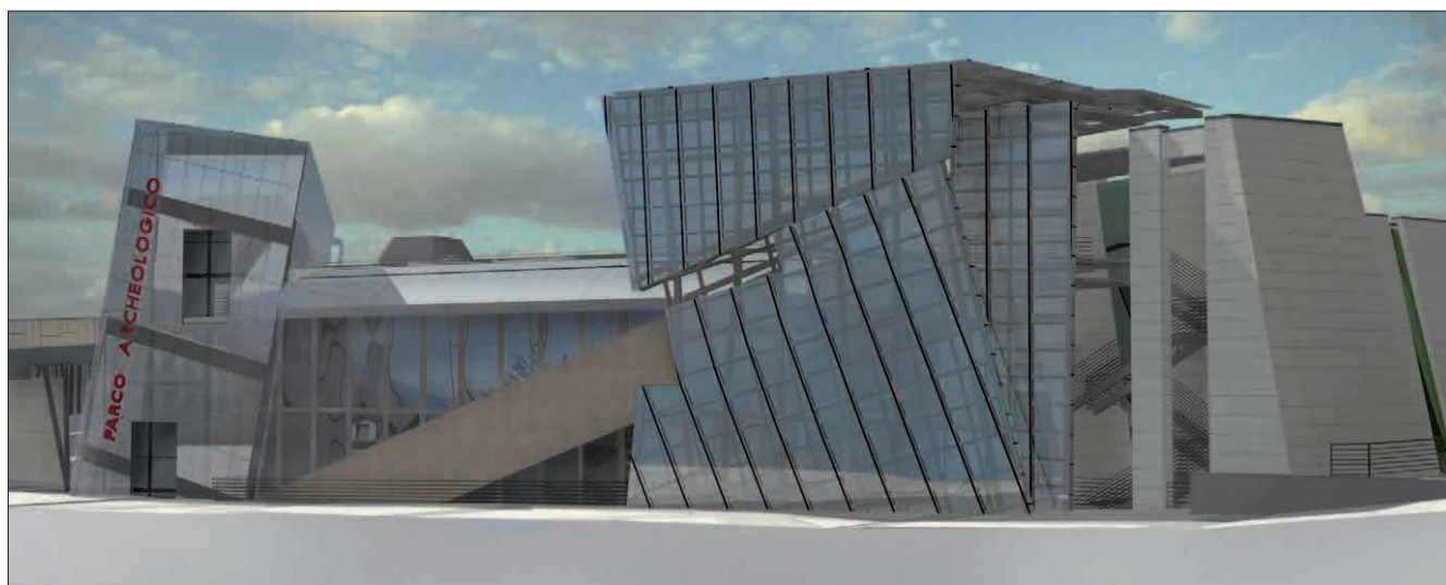
3. Rendering zona biglietteria dal progetto Valletti-Curti-Vallacqua. (Viola-Tresca)

Considerata l'importanza storica dell'area megalitica di Saint-Martin-de-Corléans, l'Amministrazione regionale ha ravvisato l'opportunità di provvedere ad una valorizzazione dell'intero sito grazie alla progettazione e realizzazione di un parco archeologico dedicato all'adeguata conservazione e tutela dei reperti che permetta la più vasta fruibilità e il giusto apprezzamento da parte del pubblico. I lavori hanno avuto inizio nell'anno 2006 a seguito di un concorso di idee progettuale a carattere nazionale.