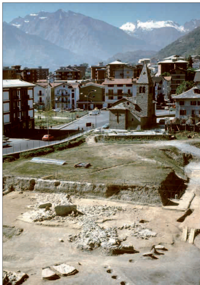
1. Il cantiere di Saint-Martin-de-Corléans nel 1978.

di culto e, pertanto, di specifiche e ricorrenti iconografie. Le stele sono state divise in "I stile" o "stile arcaico", con sagome di grandi dimensioni, spalle larghe e piccola testa, tratteggiate con pochi particolari, e in "II stile" o "stile evoluto" con spalle più strette, profilo della testa semicircolare e con un'accurata raffigurazione del volto e una resa grafica ben definita e visibile dei particolari dell'abbigliamento cerimoniale. Appartengono alla medesima fase anche piattaforme associate sulle quali, con probabilità, si svolgevano rituali e si deponavano offerte. La fase 3 (2700-2300 a.C.) è caratterizzata dalla presenza di un allineamento di pozzi rituali al cui interno vengono deposti macine e semi di frumento, spesso associati a ciottoli e scaglie litiche. Queste prime tre fasi di frequentazione del sito corrispondono a specifici rituali, che rappresentano simbolicamente i diversi strati in cui era divisa la società dell'epoca: la società dei pastori e allevatori è testimoniata dal rituale dell'innalzamento di pali totemici con il sacrificio di buoi; la società degli agricoltori e coltivatori di cereali lascia testimonianze con il rito dell'aratura e la deposizione di macine e semi nei pozzi; mentre la testimonianza della società dei metallurgici è rintracciabile nel rituale della raffigurazione sulle stele.