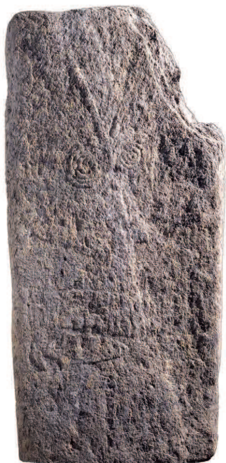
2. Stele con pendaglio a doppia spirale. (L'Image)

Un forte mutamento nella destinazione dell'area si nota dal III millennio a.C. quando il sito dedicato al culto diventa anche luogo sacro di sepoltura funeraria: infatti le stele precedentemente imposte nell'area sono reimpiegate integre o frammentarie per la realizzazione di imponenti strutture tombali. Durante la fase 4 (2300-2000) appaiono tombe dolmeniche quali ad esempio la tomba II, con un grande dolmen su piattaforma a pianta triangolare; le tombe IV, V con uno piccolo; la tomba VI a cista individuale e la struttura tombale VII. Alla varietà di tipologie di sepoltura corrispondono anche rituali funerari diversi quali l'inumazione individuale senza corredo; le sepolture collettive nei dolmen ; l'uso della semicombustione diretta e della cremazione. La fase 5 (2100-1900 a.C.) comprende tombe megalitiche quali le strutture I, III, II. La fase 6 (1100 circa a.C.) infine è contraddistinta dal muro dell'Età del Bronzo Finale.