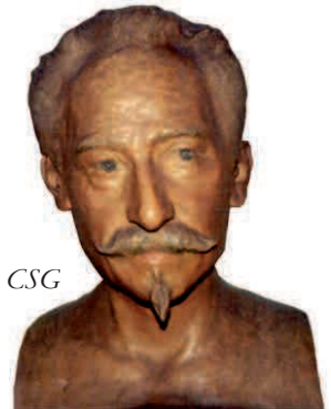
1. Edoardo Fortini Busto di Emilio Stramucci, n. inv. 129 CSG Terracotta dipinta e patinata Primo decennio XX secolo (S. Barberi)