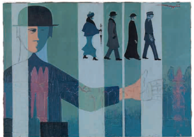
2. Giancarlo Zuppini Orfeo in Paradiso, n. inv. 691 AC Tecnica mista su cartoncino 1968 (D. Cesare)