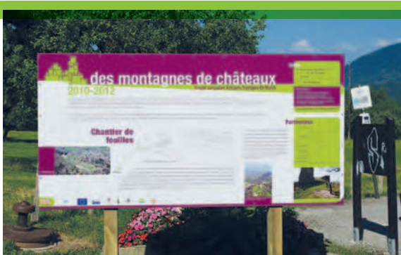
Pannello di presentazione del progetto AVER - des montagnes de châteaux dei suoi partner, studi e lavori sul sito dei castelli di Allinges (Haute-Savoie, Francia) nel 2010.

Il recupero: lavori in due tranches, nel 2006 e dal 2008 al 2009. Nella prima fase è stato effettuato lo scavo della cappella castrense e dell'area ad essa limitrofa. Nella seconda tranche di lavori è stata progettata e posta in opera una nuova copertura per l'edificio, unitamente ad una ripresa ad intonaco coprente delle pareti esterne. Parallelamente si è operato uno scavo archeologico alla base della torre, che è stata oggetto di uno specifico approfondimento di indagine. Il sito è attualmente aperto al pubblico, sebbene manchi un percorso di valorizzazione.