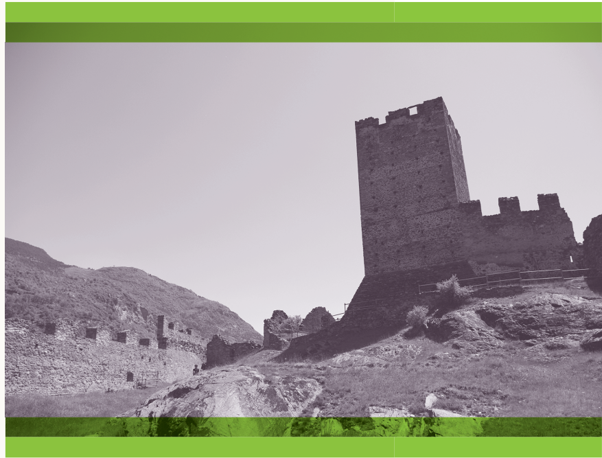
Castello di Cly (Valle d'Aosta, Italia). Particolare del percorso di visita al sito.

Les ruines : complètement en ruine, on remarque le bon état de conservation de l'enceinte maçonnée, de la chapelle castrale et de la tour maîtresse. On signale la présence de fresques dans la chapelle.