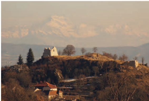
Château de Chaumont (Haute-Savoie, Francia). Un castello valorizzato nel suo ambiente naturale.

Il recupero: la progettazione, in gran parte associativa, è durata dal 1997 al 2007, i lavori dal 2005 al 2007. Importanti opere di disboscamento e di manutenzione. Restauro delle murature nell'obiettivo di una messa in sicurezza delle rovine. A tutto il 2012, manca ancora una formula di gestione del sito.