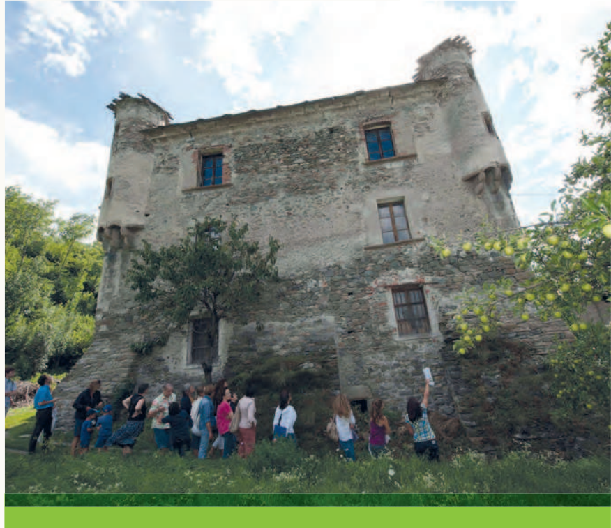
Casaforte di Saint Marcel (Valle d'Aosta, Italia). Visite guidate per la popolazione.

Ce cas de figure concerne tous les sites n'ayant connu que des travaux de nature conservatoire. Ce premier niveau permet la restitution à la population du fruit des études réalisées, souvent financées par de l'argent public. La connaissance historique, archéologique et architecturale peut être présentée sous forme de panneaux, mais aussi de plaquettes ou encore être dispensée par des professionnels du patrimoine (archéologues, historiens,