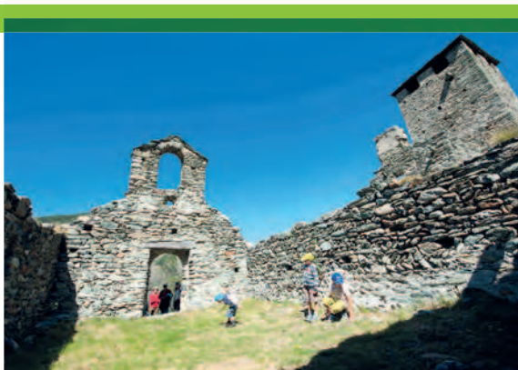
Castello di Graines (Valle d'Aosta, Italia). Visite guidate per la popolazione.

È il caso di tutti quei siti interessati unicamente da lavori di tipo conservativo. Questo primo livello permette la restituzione alla popolazione degli studi realizzati, spesso finanziati con denaro pubblico. La conoscenza, architettonica, storica ed archeologica, può essere presentata sotto forma di pannelli, targhe o ancora essere veicolata dai professionisti della cultura (archeologi, storici, guide e mediatori...). La mediazione delle informazioni può essere affidata a guide professioniste, a seconda della sfera d'interesse all'interno della quale si inserisce il sito. I supporti alla