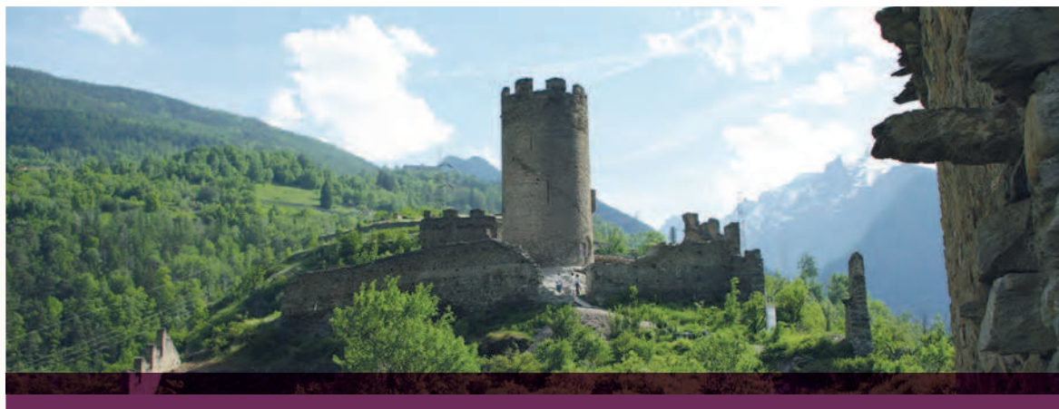
Château-Argent de Villeneuve (Vallée d'Aoste, Italie) La torre cilindrica simbolo del Castello.