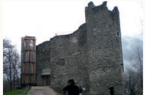
Casaforte di Esserts-Blay (Savoie, Francia). Un monumento in rovina diventato un centro polivalente.

Il recupero: dal 1992 al 2008. Ridestinazione del complesso, divenuto sala polivalente, dopo essere stato analizzato da uno studio archeologico intrapreso per iniziativa di un'associazione. Consolidamento delle strutture mediante stesura di intonaco e rifacimento delle teste dei muri: inserimento di piani intermedi e di un tetto-terrazza. Edificazione di una « quarta » torre realizzata in legno. Progettazione e dotazione dell'interno della struttura in relazione alla sua nuova valenza di sala polivalente.