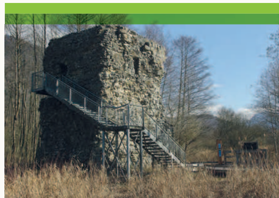
Torre di Beauvievier a Doussard (Haute-Savoie, Francia).

http://www.legifrance.gouv.fr/affichCode.do?cidTexte=LEGITEXT000006074236