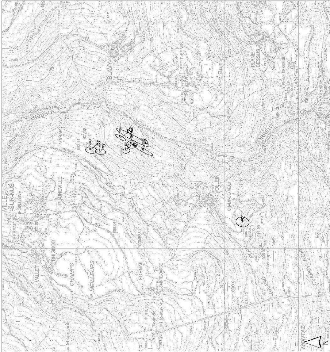
Figura. n. 2: vettori di spostamento GPS a lettura manuale.