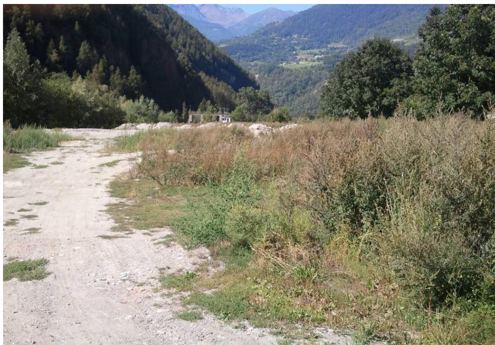
Foto n.1 Immagine principale del sito