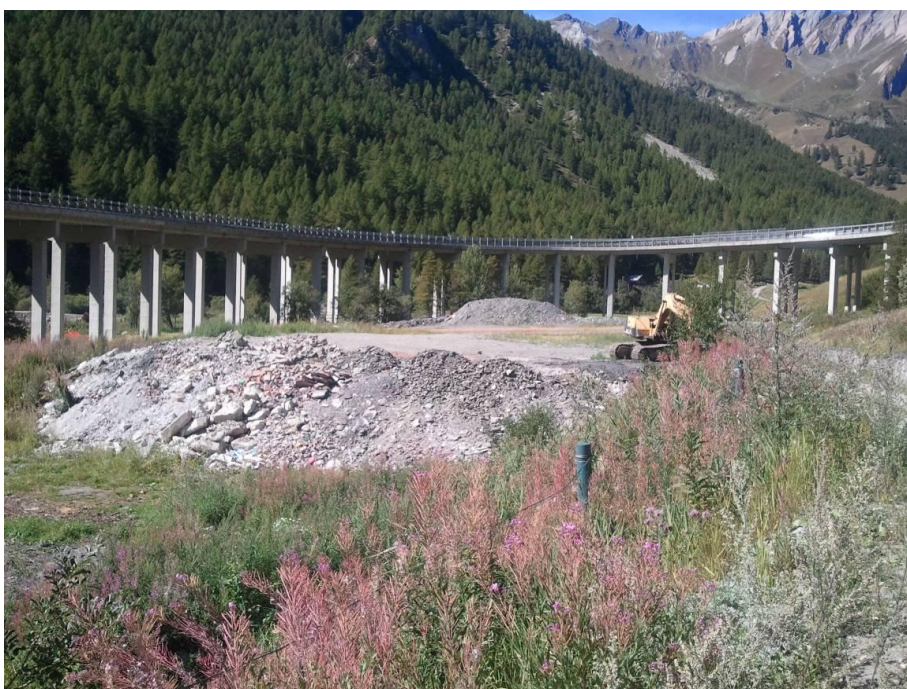
Foto n.1 Vista del sito di s.Rhemy en Bosses