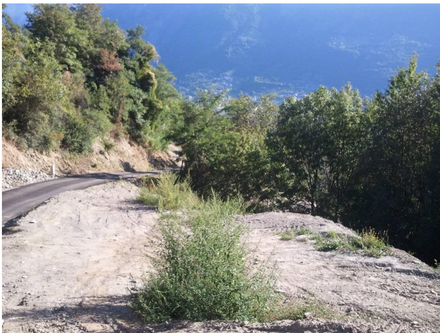
Foto n.1 Immagine principale del sito e della zona di accesso.