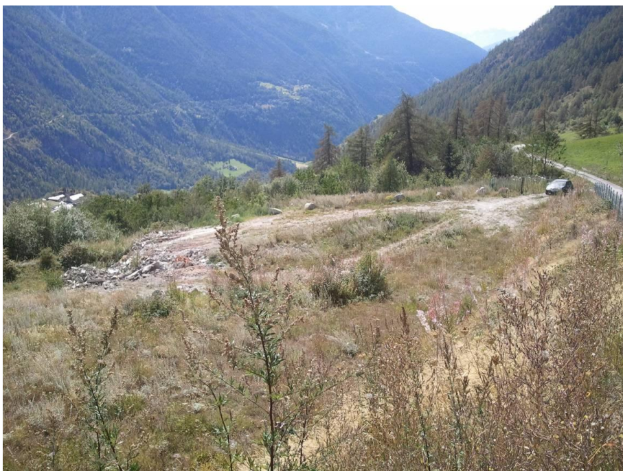
Foto n.1 Immagine principale del sito