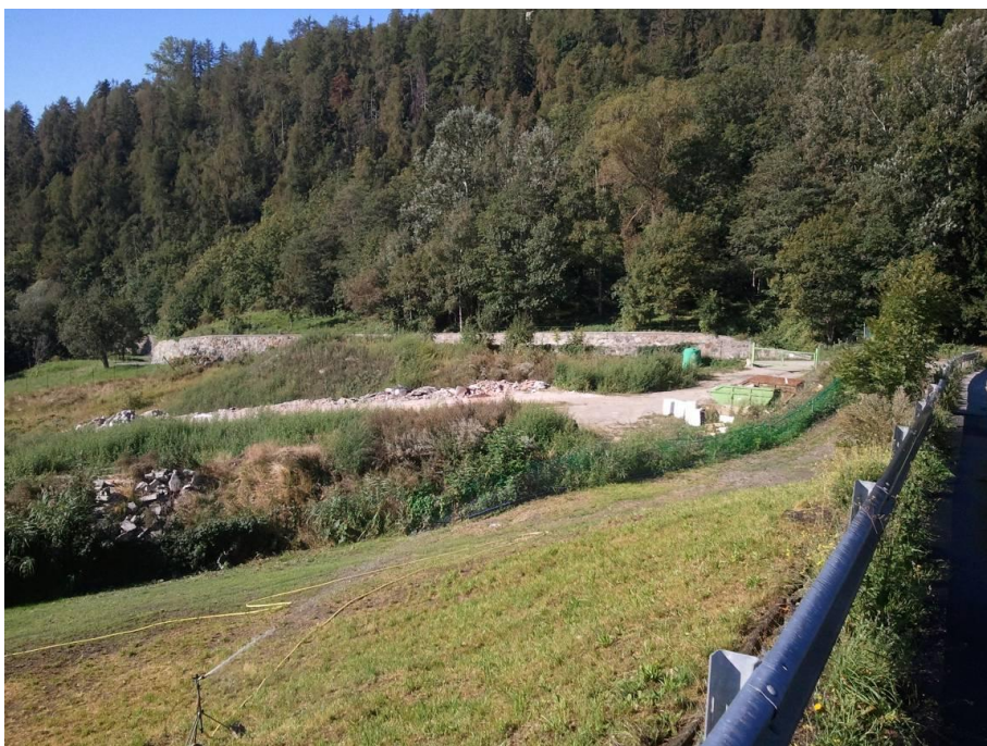
Foto n.1 Immagine principale del sito