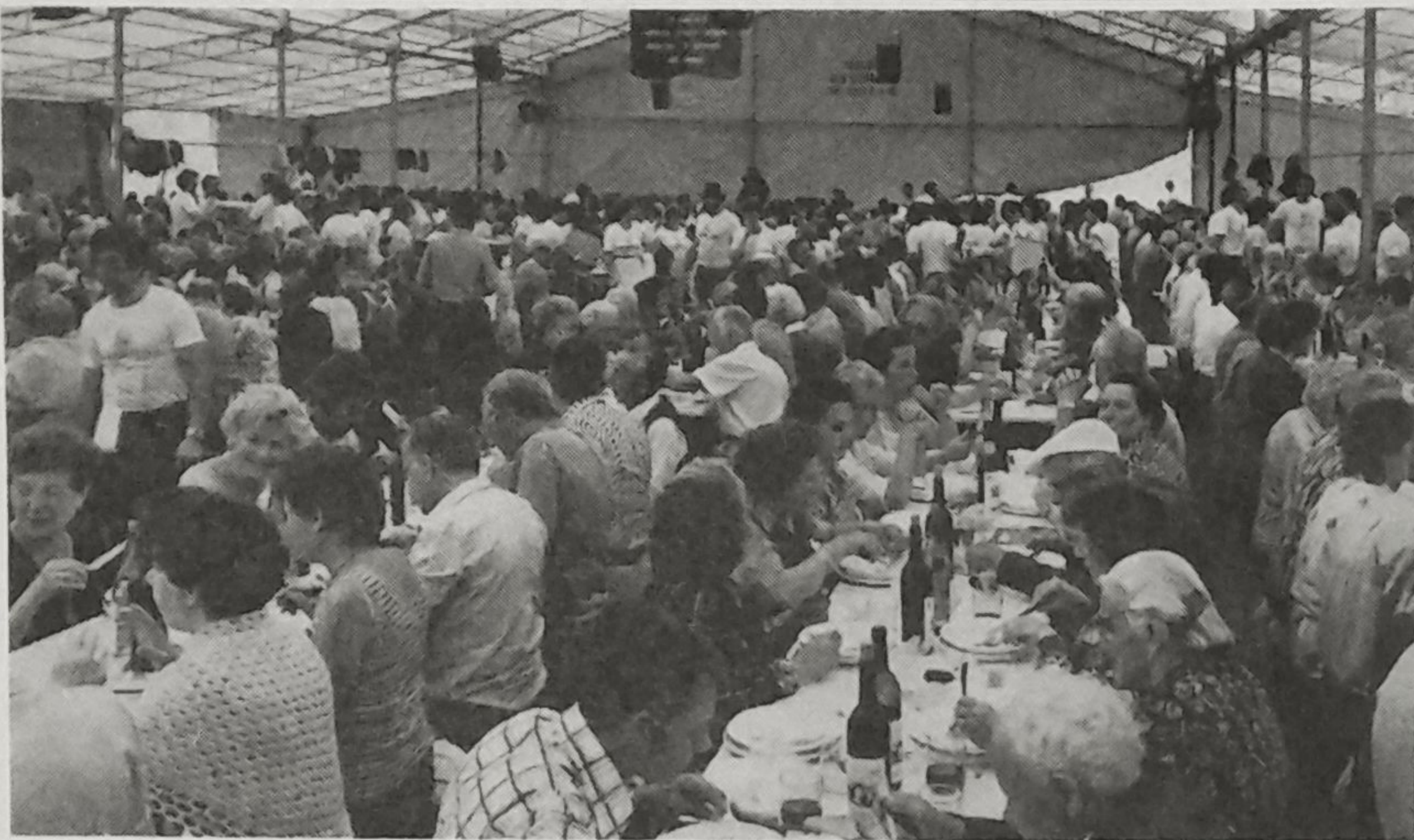
I numerosi emigrati alla Rencontre Valdôtaine

Organizzata quest'anno ad ArpUILLES - ExcENEX, la Rencontre Valdôtaine ha festeggiato, nelle centinaia di emigrati presenti, il lavoro valdostano all'estero. La manifestazione, a poco meno di vent'anni dalla sua istituzionalizzazione (prima sopravviveva, come precisa il presidente del consiglio valle, a livello spontaneo, come moto naturale che prescindeva dalle convinzioni politiche), si è articolata in un programma sobrio ed essenziale: deposizione di una corona ai caduti alle 11, messa poco dopo (con rito moderno in lingua madre), discorsi delle autorità a mezzogiorno, pranzo in un capannone e musiche tradizionali per tutto il pomeriggio.