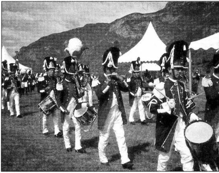
La fanfare de l'Etat-major napoléonien.

- au Comité des Traditions Valdôtaines - 3, rue De Tillier, Aoste, tél. 0165 361089.