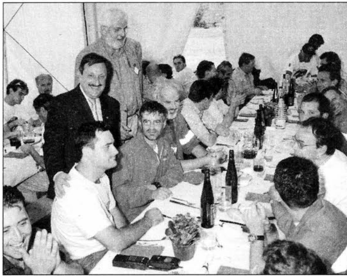
Les autorités saluent les volontaires.

Le lendemain, lundi 7 août, a eu lieu dans la petite salle du Palais régional, la traditionnelle table ronde de l'émigration valdôtaine, réservée aux différents présidents des associations d'émigrés à l'étranger, ainsi qu'aux membres du Gouvernement valdôtain et du Conseil de la Vallée. Tous les