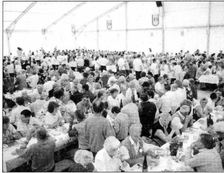
Il est temps de retrouvailles...

La 26 e édition de la Rencontre Valdôtaine aura lieu le 12 août 2001 à Jovençan.