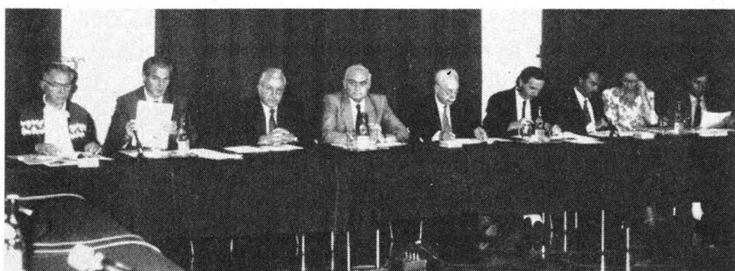
Table ronde de l'émigration

Lundi 6 août, au Palais régional, la Table ronde de l'émigration valdôtaine, complément de la journée de la veille et véri-