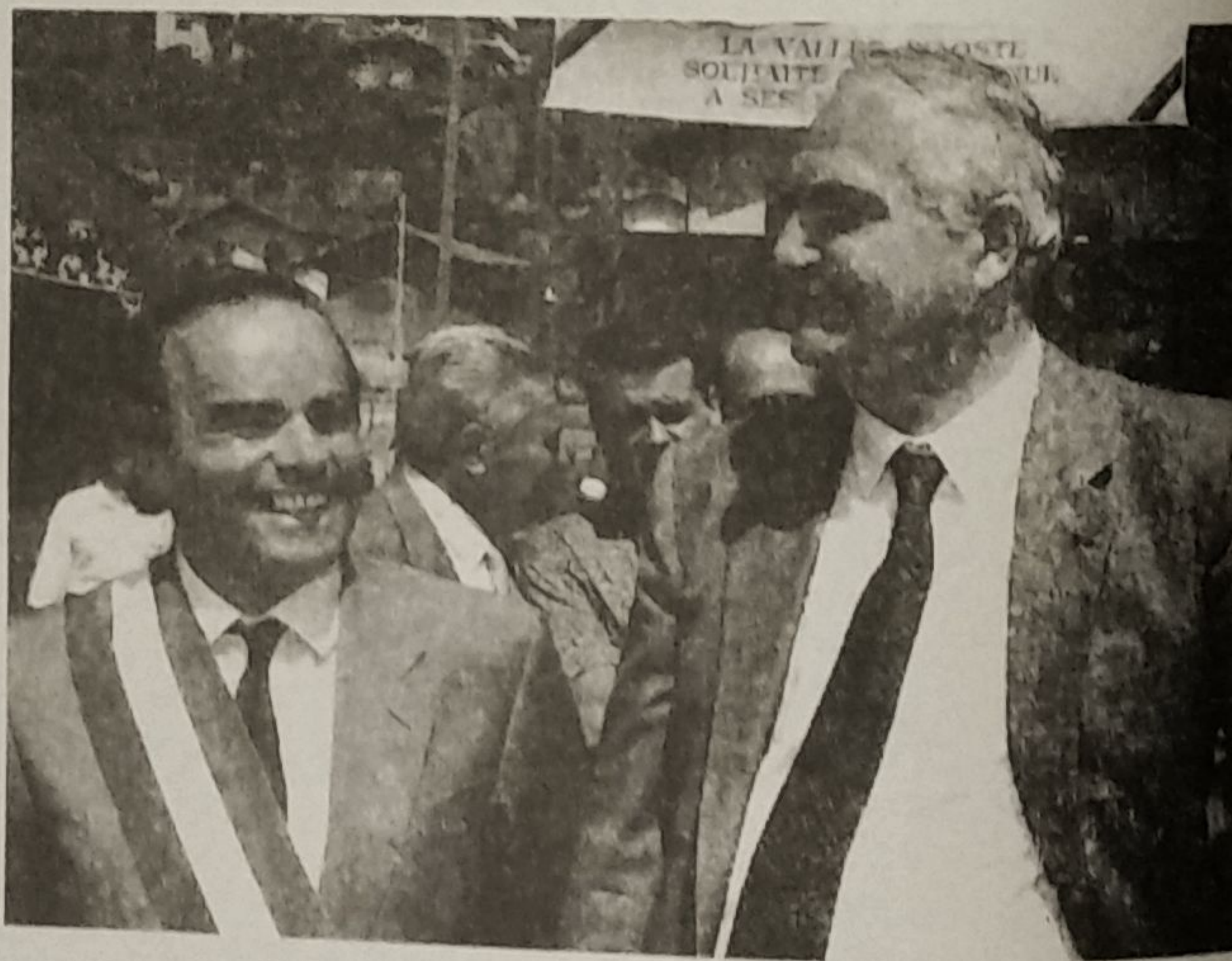
Le Président du Gouvernement régional, Bondaz, et le Syndic de Châtillon, Piccolo

La réunion d'aujourd'hui se tient à une date qui marque une consolidation de la majorité née le 25 juin 1990: une majorité qui s'est attachée à œuvrer malgré les nombreuses difficultés, aussi concrètement que possible dans l'intérêt de