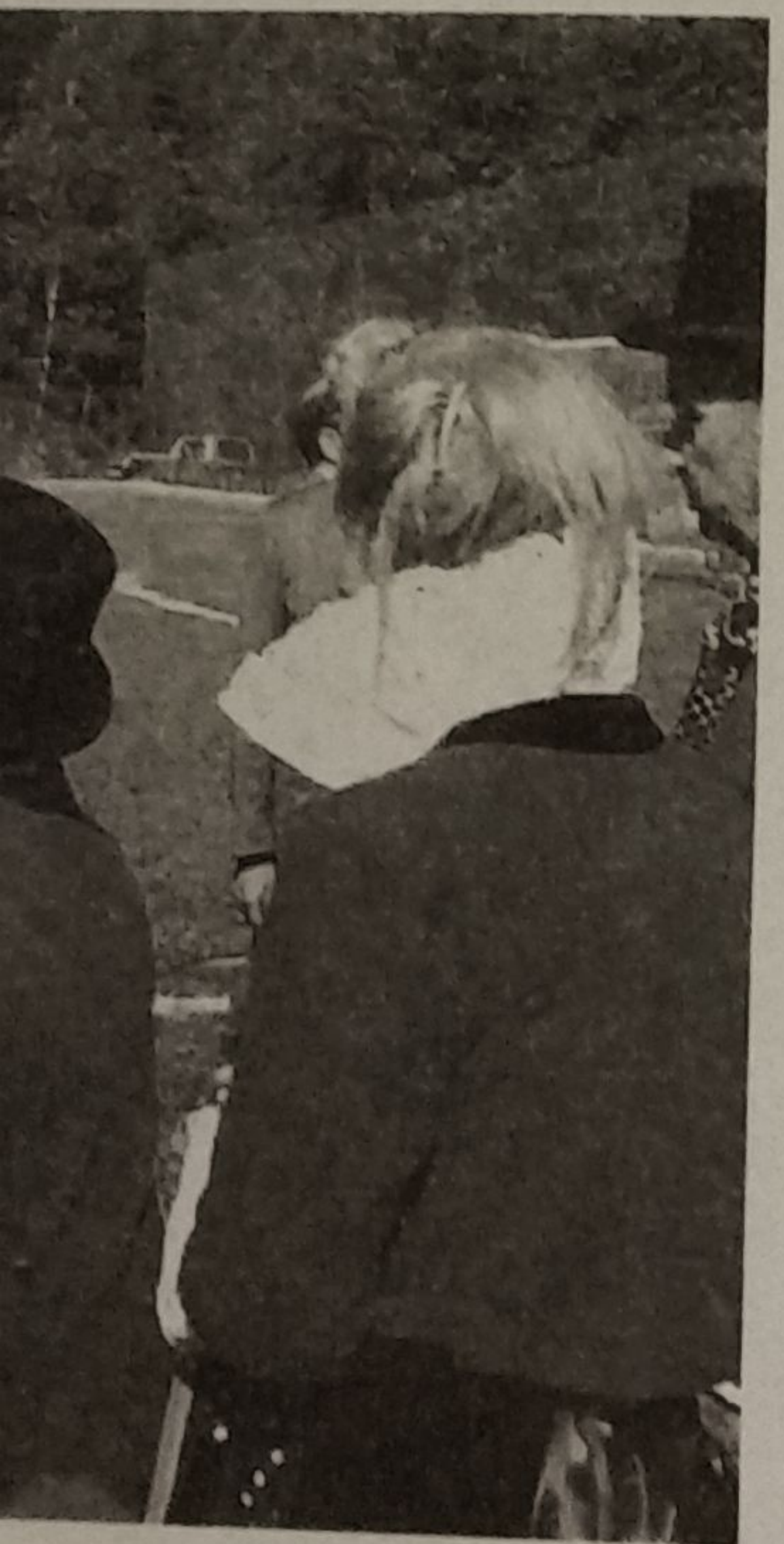
a Courmayeur el comunie, Tamietto