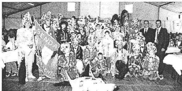
La Commune de Valpelline a mobilisé pour cette occasion quelques 200 volontaires: les responsables des Sociétés d'émigrés ont exprimé leur "immense satisfaction"