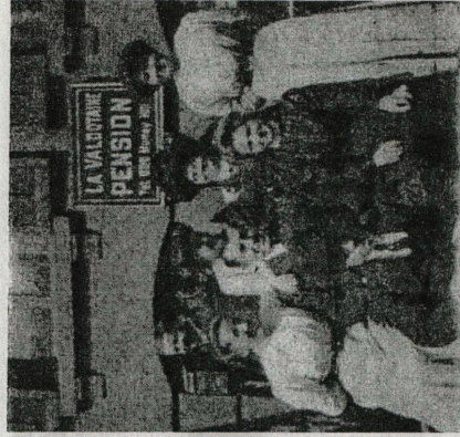
Un esempio dell'emigrazione valdostana dell'inizio del XX secolo: "La Valdôtaine Pension" a Quebec City in Canada

Les jeunes seront donc les protagonistes de la journée, puisque le programme de l'après-midi débutera, dans la salle de l'école maternelle, par le concert du chœur «Les enfants du Grand-Paradis», accompagné par «Les notes fleuries du Grand-Paradis», concert qui sera suivi d'un spectacle théâtral interprété par les enfants de la Communauté de montagne. L'école maternelle de Saint-Pierre a, pour sa part, contribué à l'organisation de la manifestation en réalisant, au cours de