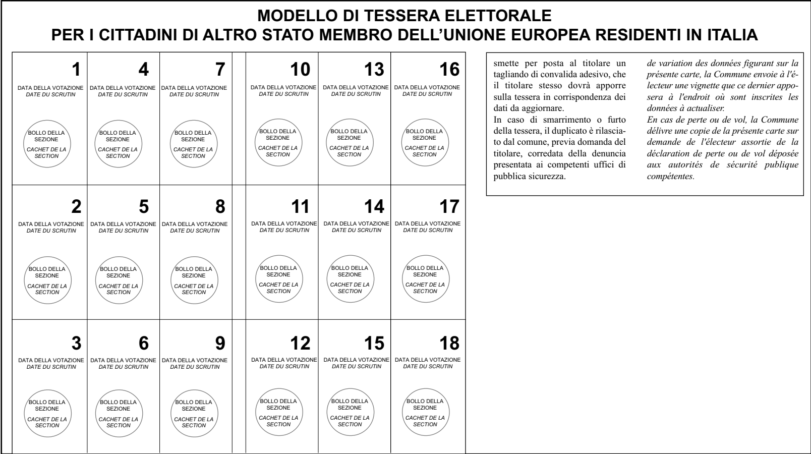
TABELLA D (2ª Parte)