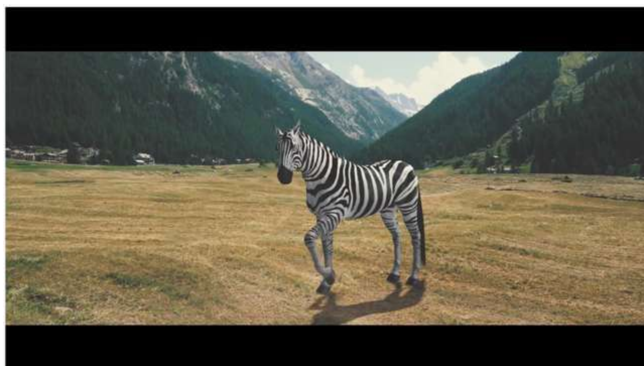
Gran Paradiso Film Festival 2021 | Al via la 24° edizione