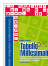
TABELLE MILLESIMALI - II EDIZIONE