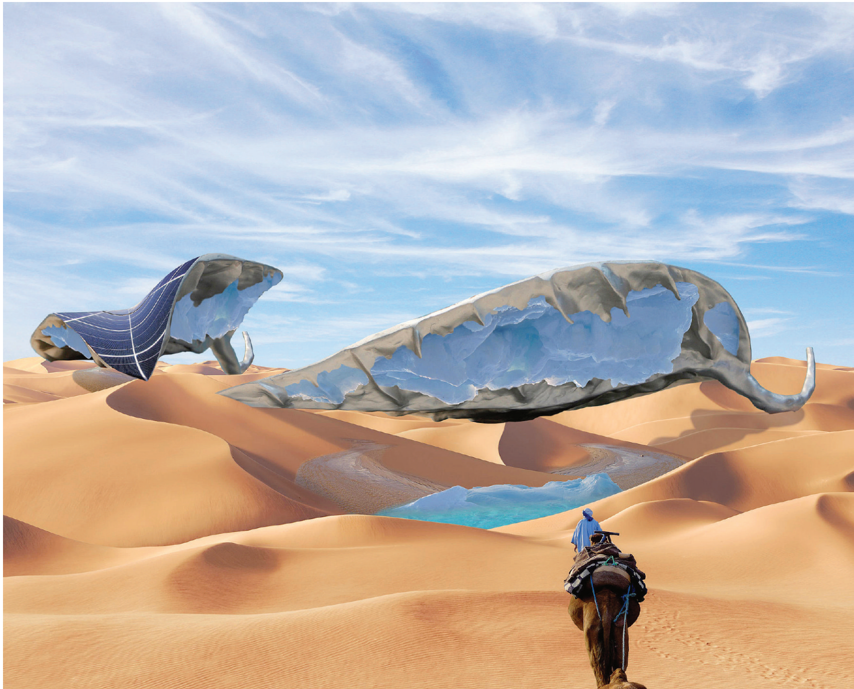
L'artista olandese Ap Verheggen ha immaginato l'installazione di un impianto solare nel deserto

Dal solare fino alla geotermia parte la sfida delle fonti alternative . I progetti di Enel, Sorigenia ed Hera . Resta l'incognita del riassetto Edison: A2A e Iren riusciranno a creare un polo di energia pulita ?