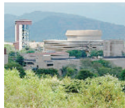
Una centrale «modulare»

Le centrali di quarta generazione sono comunque un notevole salto in avanti. Innanzitutto perché si abbandona il ricorso all'uranio-235 come combustibile per utilizzare l'uranio-238, che in natura è più diffuso (99,28% contro lo 0,71). In realtà dall'uranio-238 si ricava il plutonio, che è il vero combustibile bruciato. Altro vantaggio: quando il reattore è in attività, i prodotti di fissione sono riciclati all'interno, tranne gli elementi transuranici, quelli più radioattivi,