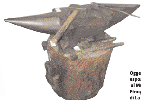
Oggetto in esposizione al Museo Etnografico di La Salle