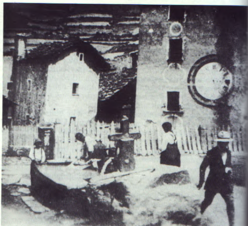
Lou beuil de la métaneire