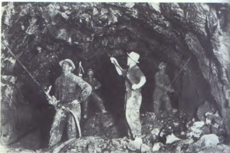
Mineurs au travail en galerie

Les éléments qui constituent l'identité d'une communauté vivent dans toute manifestation humaine. Ils forment l'ensemble des comportements que chaque membre du groupe exprime dans sa façon propre de se poser face à la réalité.