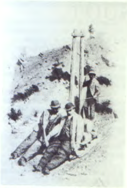
Cogne, la descente du minerai de fer

Celles, où souvent l'invisible est ce fil de la continuité qui relie passé et futur et les rend interagissants dans le processus, qu'on ne peut arrêter, d'avancement continu dans le temps, qu'est l'aventure de l'homme sur la Terre.