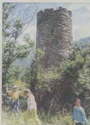
La "Tournalla" sovrasta dall'alto il borgo.

Il borgo si trova sulla strada medioevale; il centro, raggruppato intorno alla cappella, presenta case vecchie, molte delle quali sono state ristrutturate. Vicino alle vecchie case sono sparsi