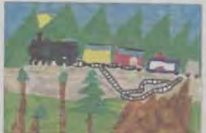
Un ponte morto in comunicazione Villefranche con Brusson: il ponte odierno è stato costruito nel 1950, il vecchio ponte è crollato durante un'alluvione.

A Nord, costeggiando le case, passa la ferrovia, la cui costruzione risale all'anno 1885. Il primo treno è transitato nel 1886. A Sud del borgo scorre la Dora Baltea; lo passano essa fermissa, lungo il suo corso in direzione del borgo, dei "vassan" che davano origine a delle "lie". Su queste prosperava una rigogliosa vegetazione; tutta la popolazione del borgo poteva accedervi per tagliare legna e per pascolare le mucche. Molto spesso, durante le piene, l'acqua della Dora straripava e allagava le cantine delle case vicine. Ora sono stati costruiti degli argini ben solidi.