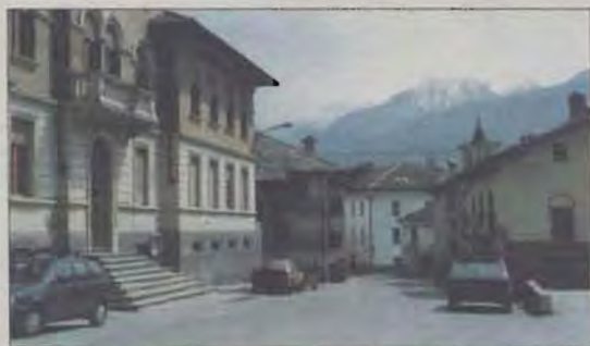
Villefranche: capoluogo del Comune di Quart