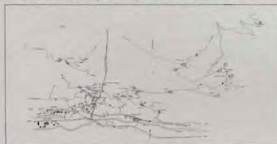
Realizzato dagli alunni della Scuola elementare di Villefranche. Anni scolastici 1989-90 e 1990-91

Tra Nus e Aosta, lungo la strada nazionale, si insedia, a l' "adret", il borgo di Villefranche, capoluogo del comune di Quart. Si trova a m. 547 circa sul livello del mare.