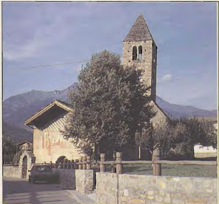
L'église de Sainte Madeleine, à Gressan, un vrai joyau de l'art valdôtain du Moyen Age.

Per qualunque richiesta di chiarimento o di materiale didattico ci si può rivolgere all'U.S.D. presso la Curia Vescovile - Via Hôtel Des Etats, 15 - 11100 Aosta - Tel. 0165/238517 - dal lunedì al venerdì dalle ore 9 alle 12.