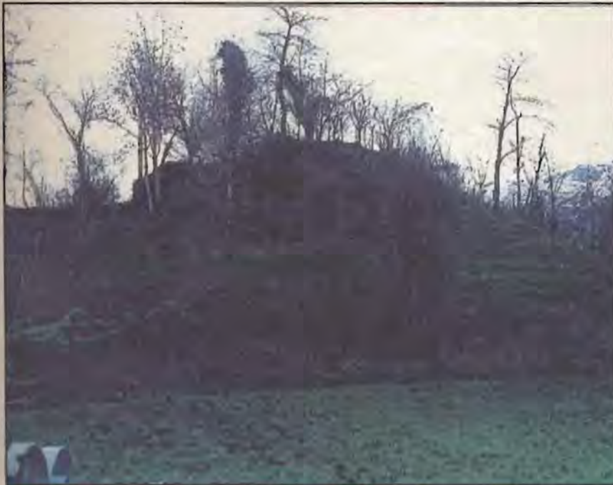
Les toponymes ont parfois tiré leur origine de la structure du territoire. En ce cas le nom "Tzanté" est dû à la petite colline qui caractérise l'endroit.