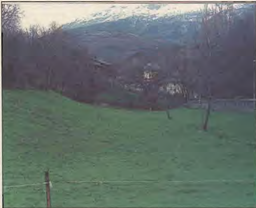
La Comba de Saumont doit son nom à la structure du territoire. Il s'agit en effet d'une petite vallée ( Comba ), qui s'ouvre vers la colline d'Aoste.

Velain 1987; Gros A., Dictionnaire Étymologique des noms de lieu de la Savoie , Chambéry 1982). Très utiles pourraient se présenter les textes classiques de la toponymie française rédigés par A. Dauzat et ses collaborateurs ( Dauzat A Deslandes G. Rostaing Ch., Dictionnaire étymologique des noms de rivières et de montagnes en France , Limoges 1978; Dauzat A Rostaing Ch., Dictionnaire Étymologique des noms de lieu en France , Le Poiré sur Vie 1984).