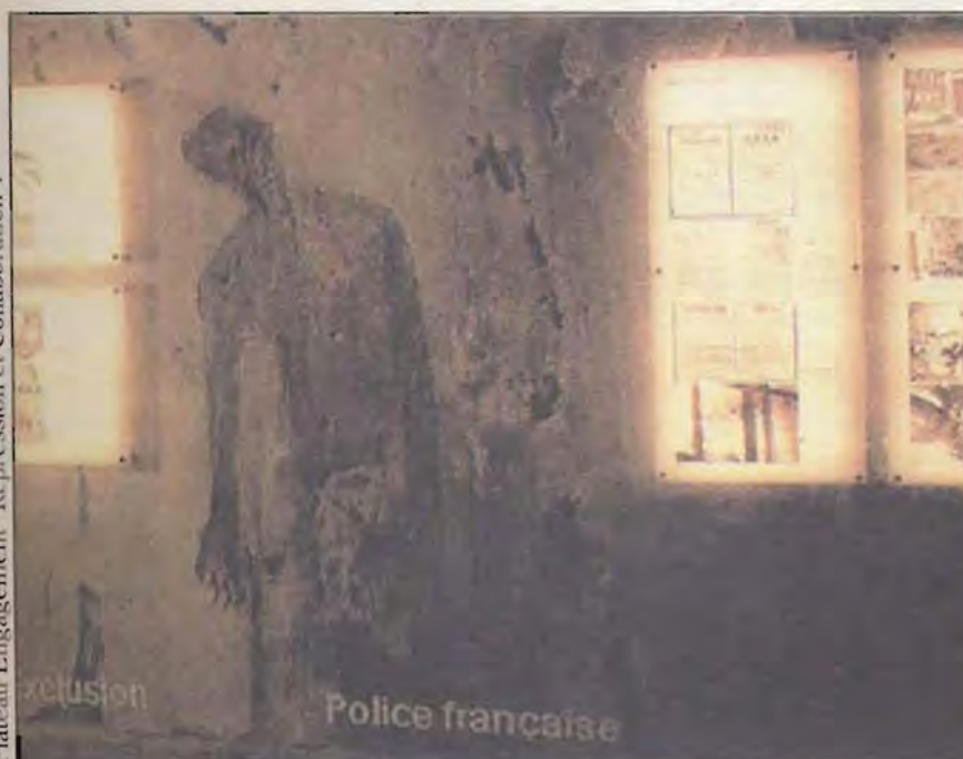
Plateau Engagement "Repression et Collaboration".

Tarifs: Prix d'entrée: 20 F. Tarif réduit: 10 F. Abonnement annuel: 200 F. Tarif réduit: 100 F. Gratuit pour les moins de 18 ans