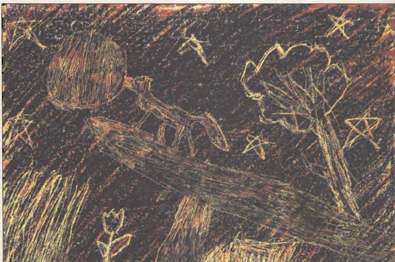
Classe 3ª - Scuola Elementare Convitto - Aosta (Disegno eseguito con la tecnica del graffito)

Termina, con questo articolo dedicato all'orientamento scolastico, la presentazione di un lavoro svolto nella scuola media di Cogne nel triennio 1993/96.