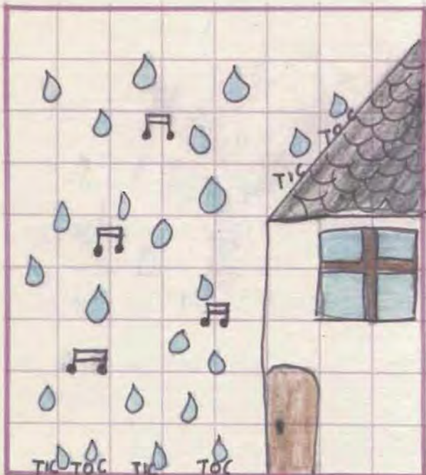
La musique de la pluie - Vincenzo Cristofaro