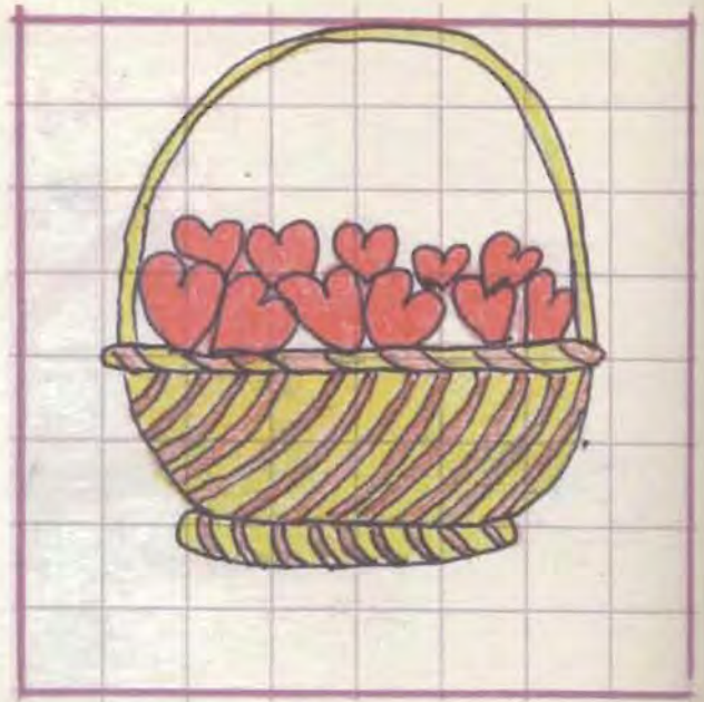
Une corbeille d'amour - Nicolas Risso