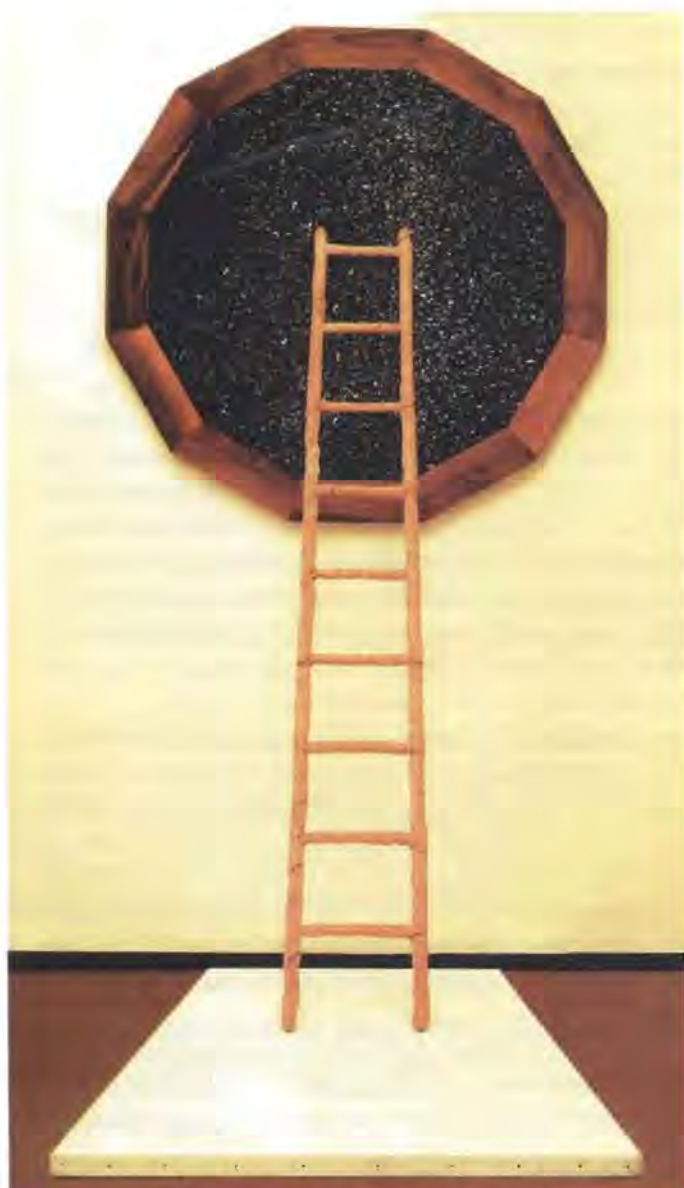
Claudia Parmiggiani – Salita della memoria, emulsione su tela, pane e legno, 1977. Brescia, Collezione privata. [FOTO S. LICITRA, MILANO] Tratto da Sfera n. 41, pag. 8 - Editrice Sigma - Tau

Cos'è il ricordo? Perché vogliamo e dobbiamo ricordare? Cosa succede in noi quando ricordiamo?