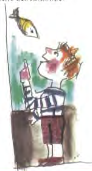
Illustrazioni: Emanuele Luzzati - Tratte da: Genova in vista! Giunti Progetti Educativi