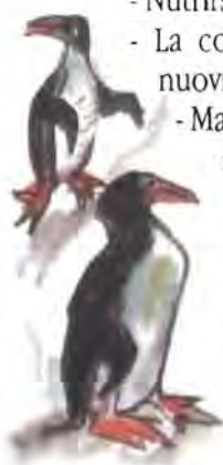
Illustrazioni: Emanuele Luzzati - Tratte da: Genova in vista! Giunti Progetti Educativi

Per un risultato efficace di una visita d'istruzione ed una migliore qualità delle attività proposte, si consiglia di visitare l'Acquario nel periodo ottobre/febbraio e di prenotare al più presto i servizi desiderati.