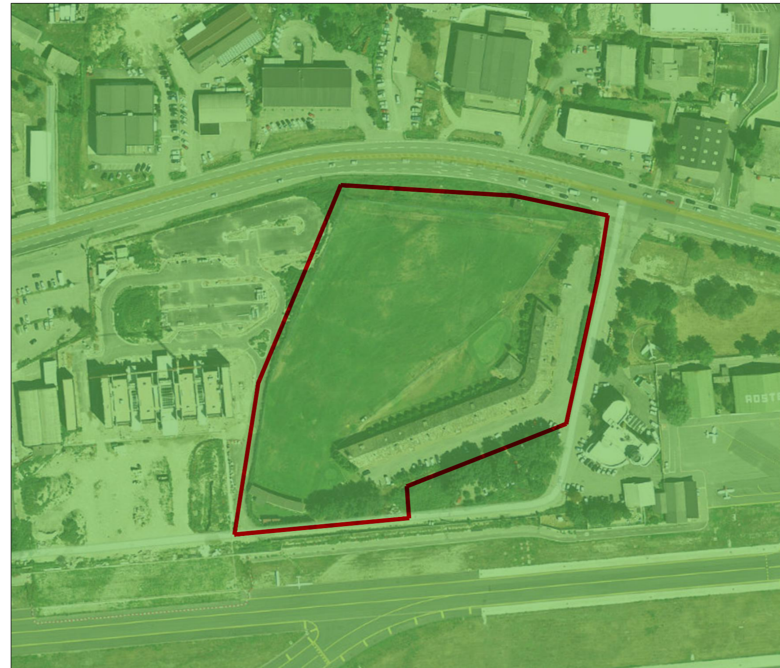
FC - Area di inondazione per piena catastrofica Ambiti ineditabili - Art. 36 L.r. 11/98 inondazioni