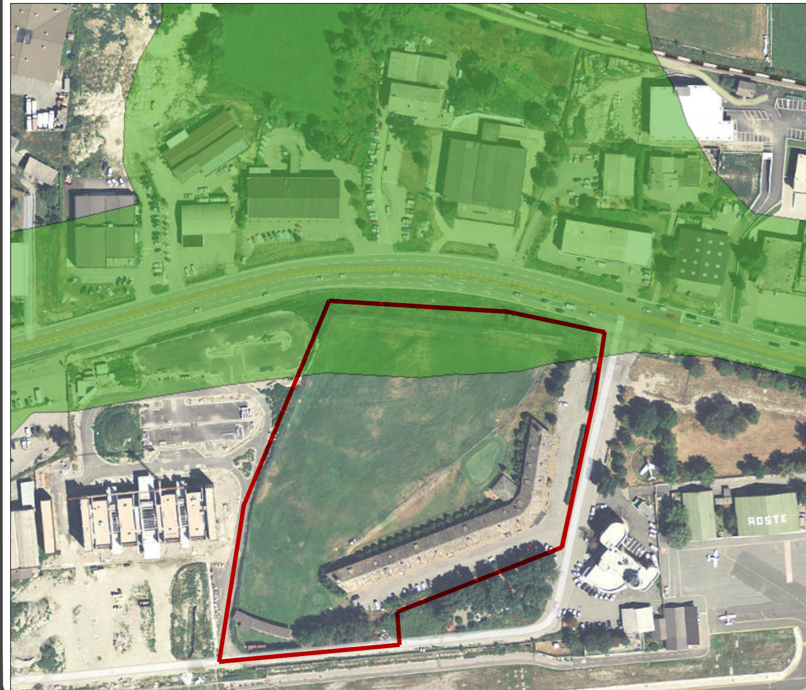
F1 - Area a bassa pericolosità Ambiti ineditabili - Art. 35 L.r. 11/98 franco scala 1:2000